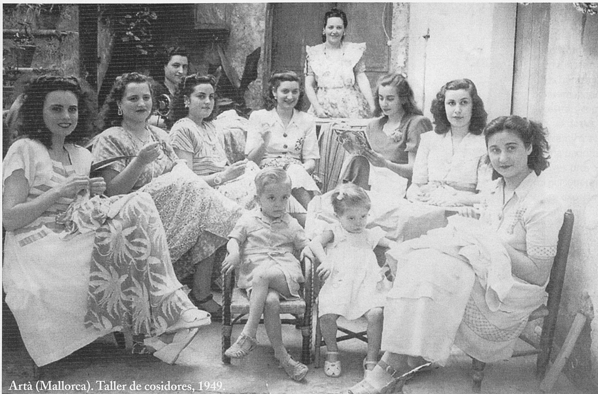
Artà (Mallorca). Taller de cosidores, 1949.