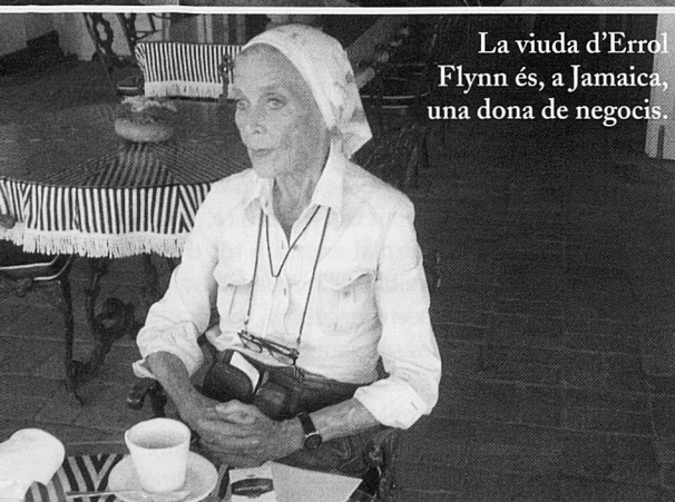
La viuda d'Errol Flynn és, a Jamaica, una dona de negocis.