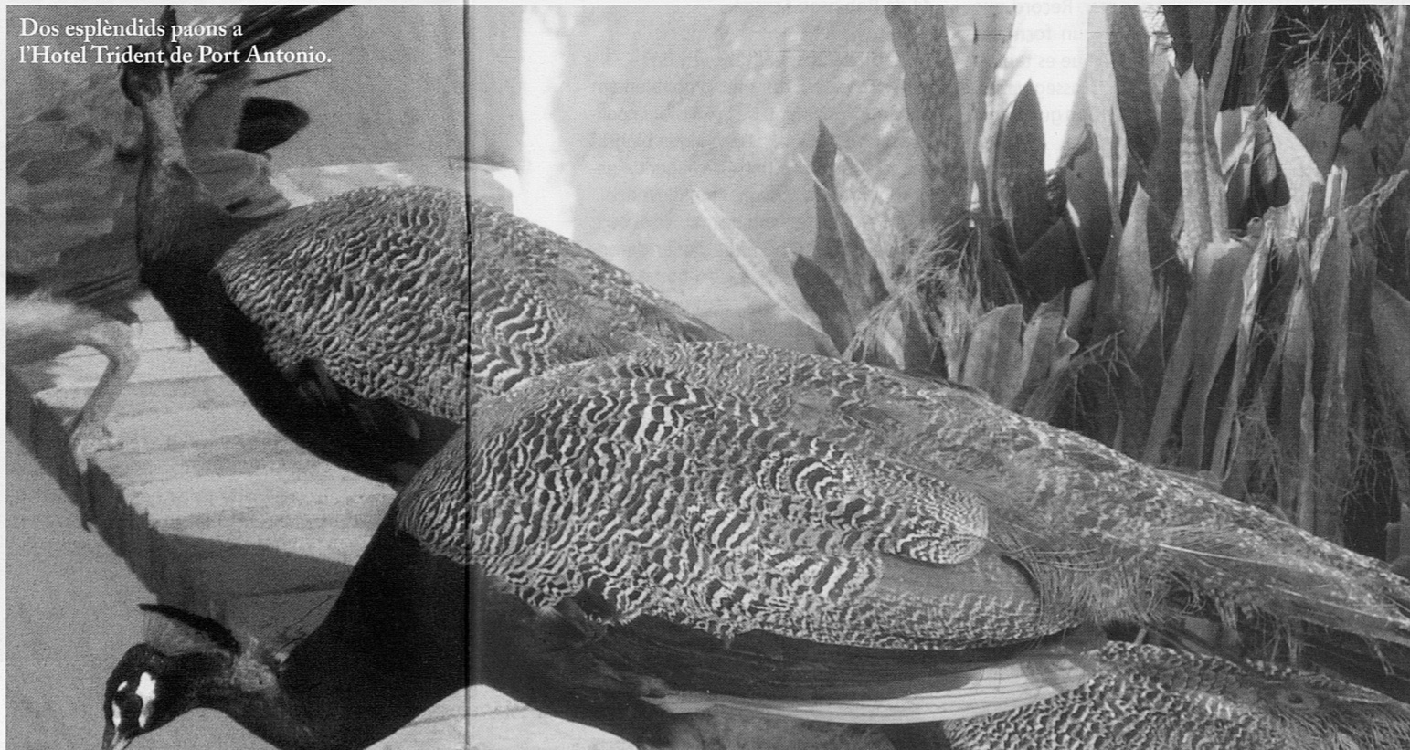
Dos esplèndids paons a l'Hotel Trident de Port Antonio.