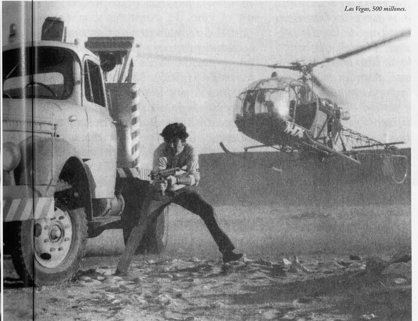
Las Vegas, 500 millones.