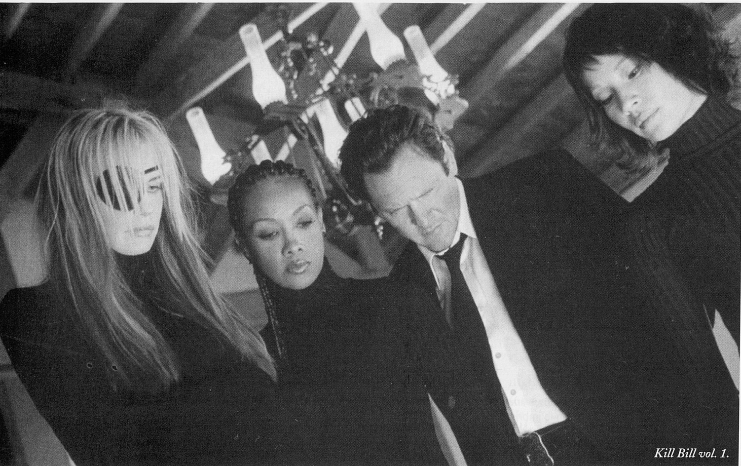
Kill Bill vol. 1.

surada planificació, però també de manera brutal i evident, a través d'una mirada directa i minuciosa, com el protagonista és assotat i la seva carn arrabassada a conseqüència de les fuetades de cadenes i fulletes que sofreix per part dels soldats romans. Un grau de bestialitat visual difícil de suportar però que respon segurament a la intenció de voler transmetre a l'espectador la mortal tortura, l'odi que va haver de patir Jesucrist per defensar obstinadament les seves idees, per convertir-se en exemple martiritzat de les seves pròpies pregàries —resulta paradoxal que sigui en el rostre de Maria on l'espectador hi troba un mirall que reflecteix de manera molt més eficaç tot el patiment i el dolor.