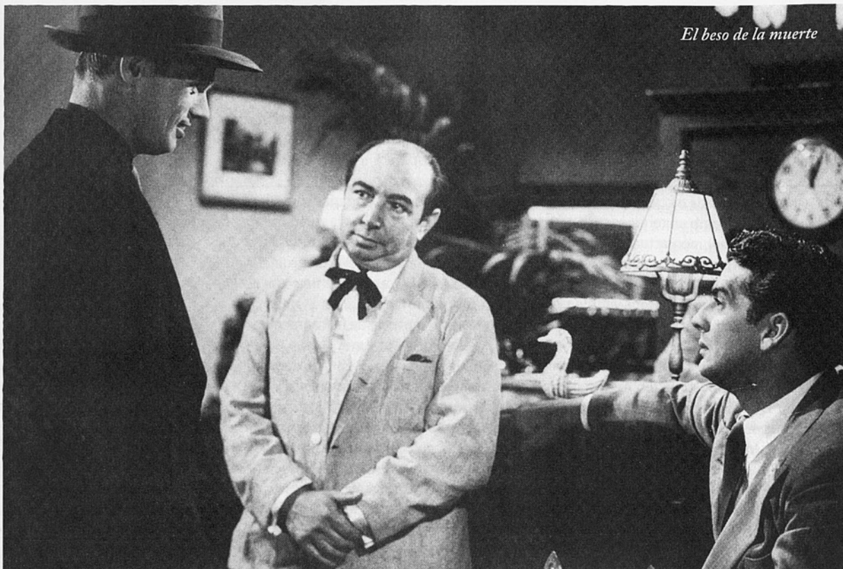
El beso de la muerte