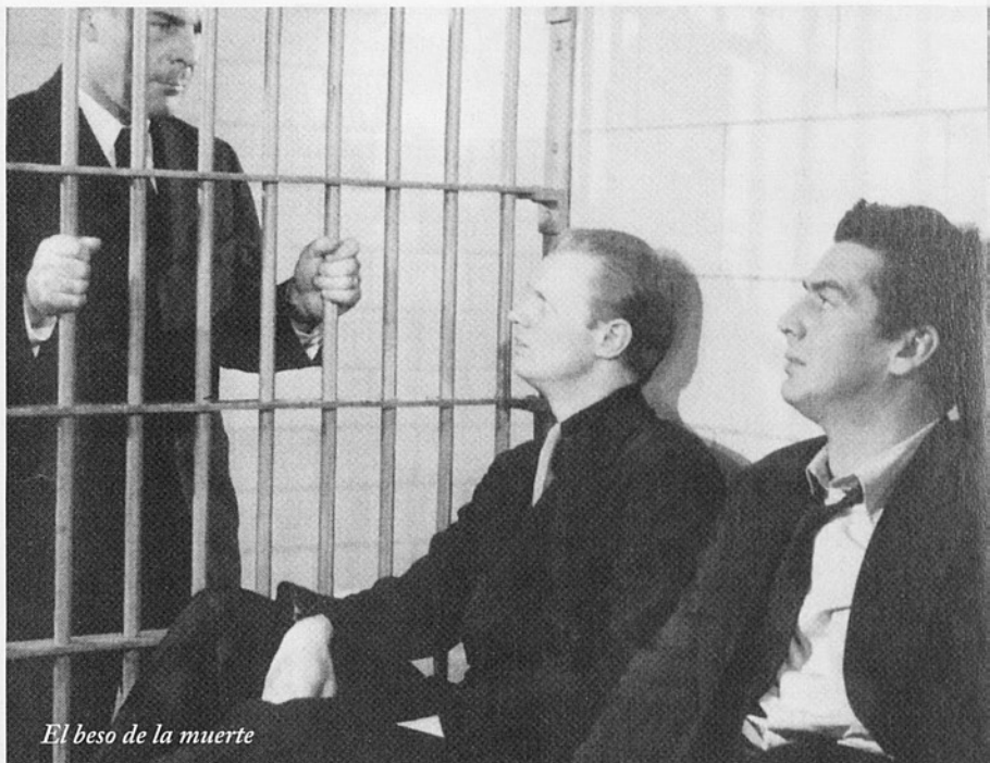
El beso de la muerte

La següent escena, és de Pulp fiction de Tarantino, que marca una diferen-