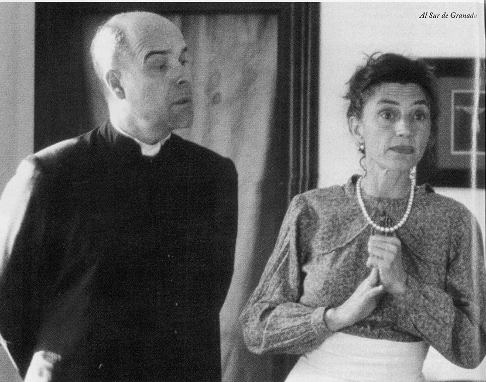
Al Sur de Granada