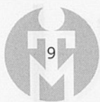
Al Sur de Granada