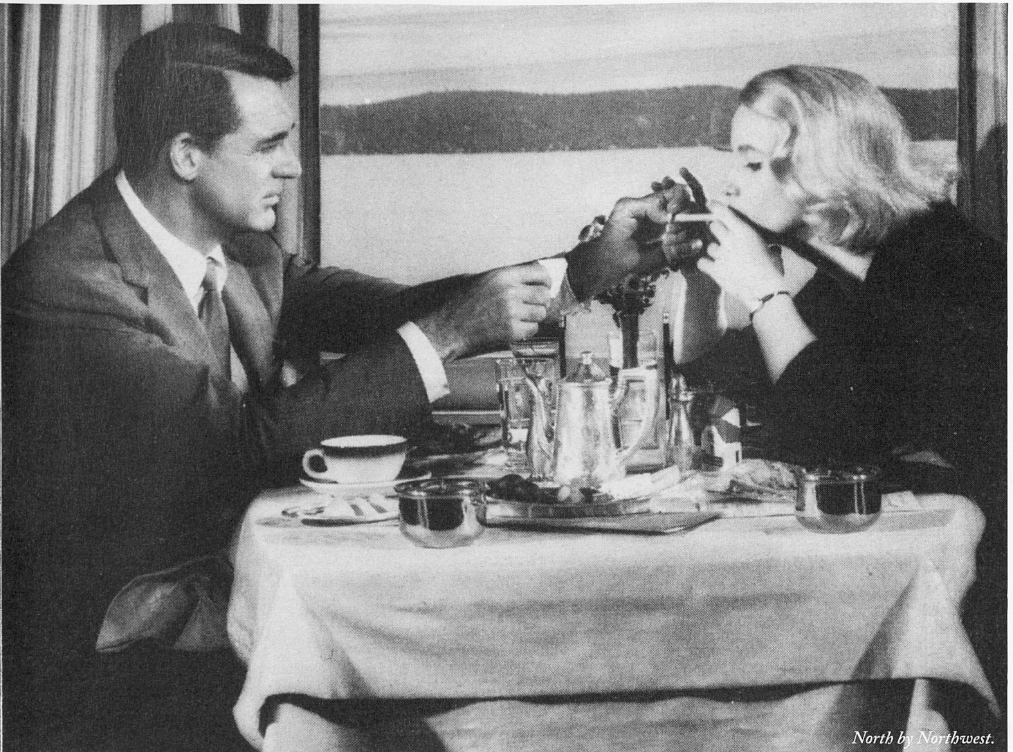
North by Northwest.