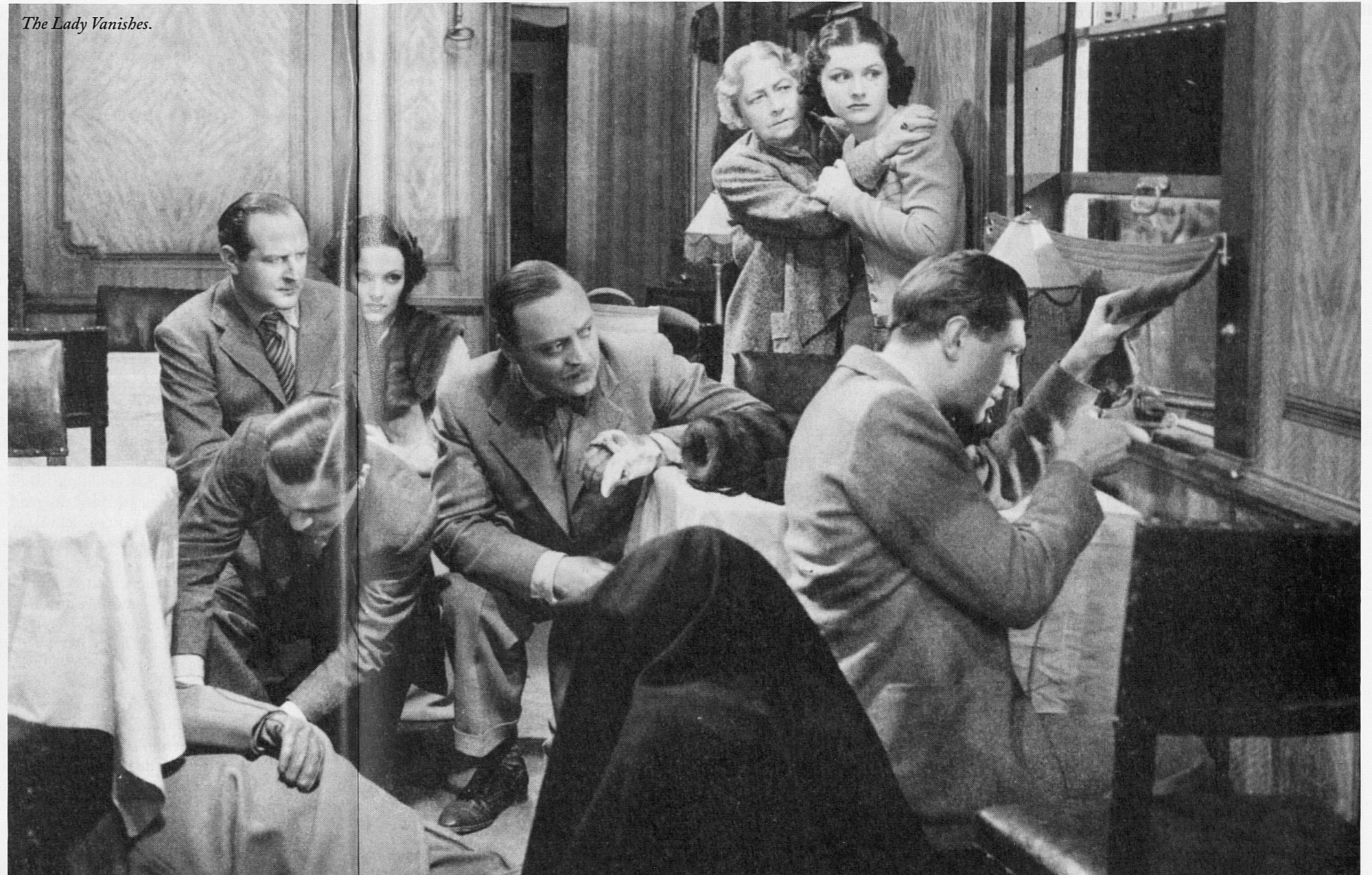
The Lady Vanishes.

sió fugissera de realitat, una credibilitat de la imatge propera a la de les teles de Maigritte, una realitat que és rere la realitat. Hitchcock surrealista? En tot cas, no deixa de ser interessant pensar que va treballar amb Dalí i que el seu cinema posa en escena molt aviat fins i tot sessions de psicoanàlisi. És més, la transparència apareix, en Hitchcock, associada a l'inconscient molt aviat, el 1930, amb Murder , quan el trapezista que es deixarà caure del trapezi després d'una sèrie de tombarelles sobre el mateix eix suggerides per