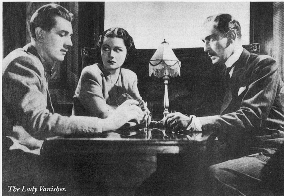
The Lady Vanishes.