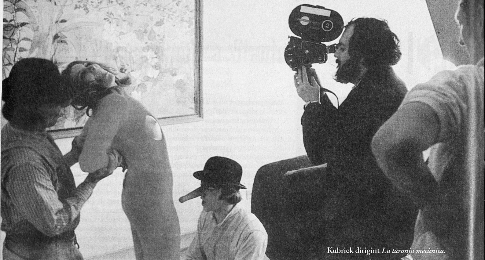
Kubrick dirigint La taronja mecànica .