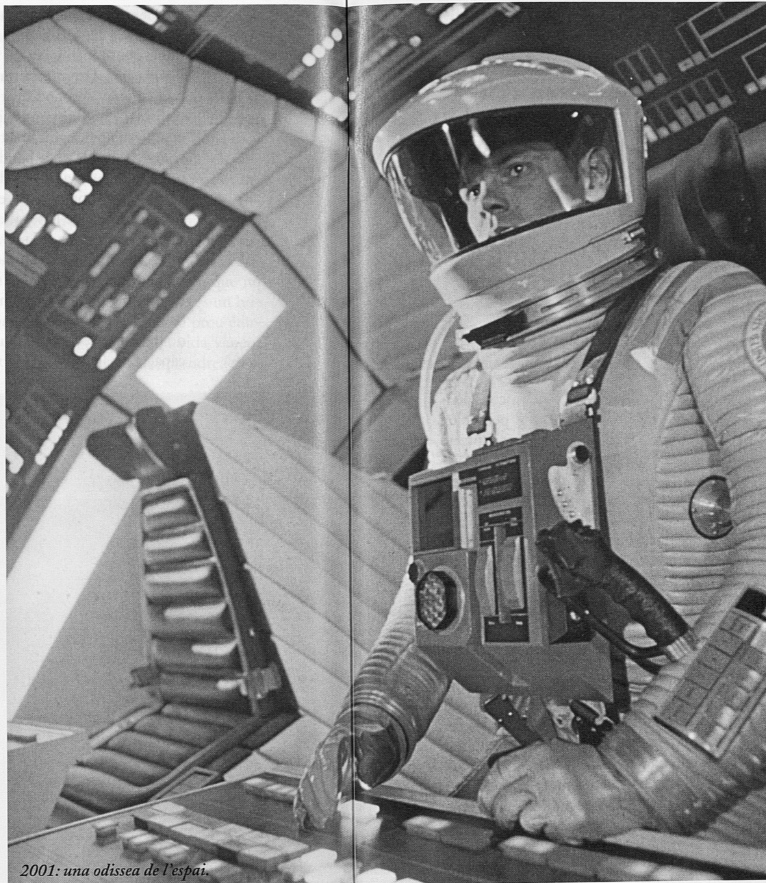
2001: una odissea de l'espai.