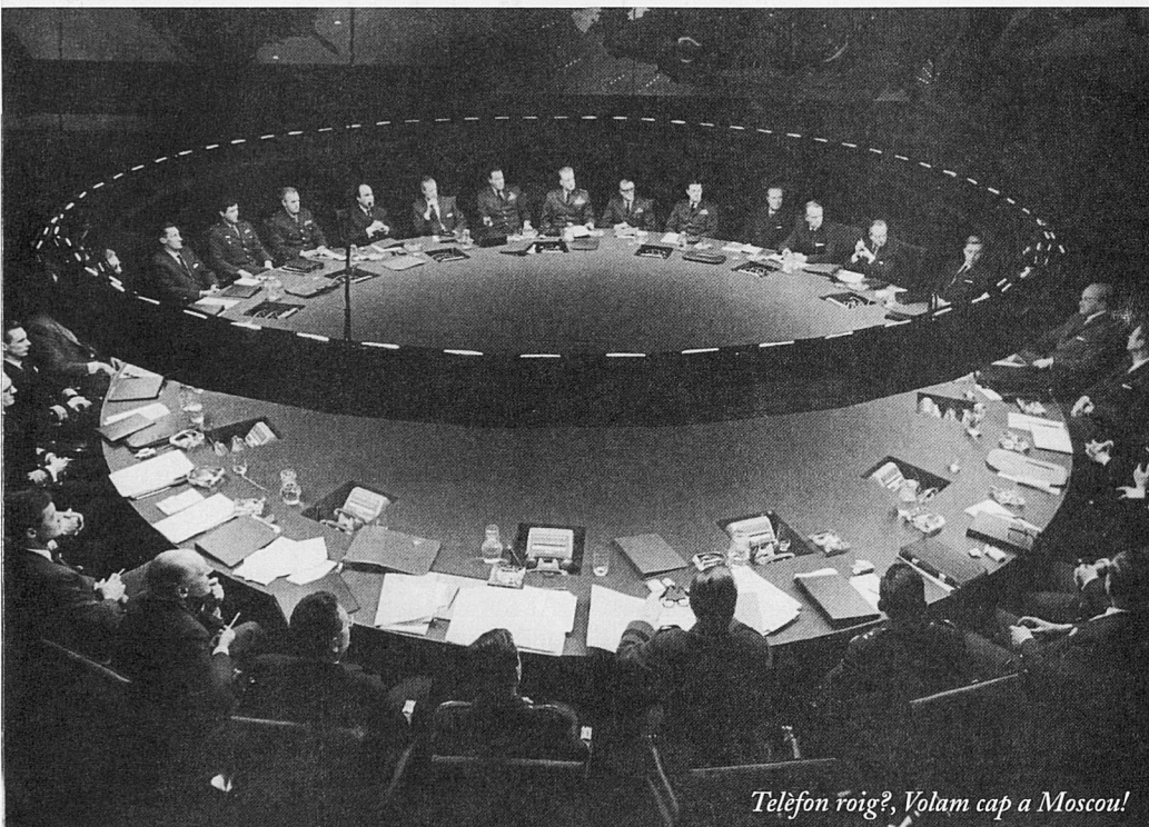
Telèfon roig?, Volam cap a Moscou!