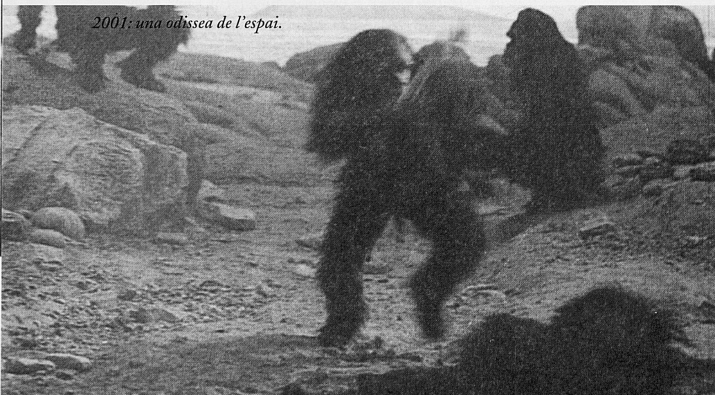
2001: una odíssea de l'espai.

un efecte perdurable en la consciència de l'espectador. Basta pensar en Lolita (1962), una clàssica adaptació de la famosa novel·la de Vladimir Nabokov; Telèfon roig?, Volam cap a Moscou! (1963), una farsa sobre la guerra freda i el possible enfrontament nuclear entre els nord-americans i els soviètics. L'any 1968, fent el servei militar a Cartagena, vaig poder anar a l'estrena de 2001: una odíssea de l'espai que, igualment com moltes de les obres que hem anat comentant, ha esdevingut un clàssic, en aquest cas de la ciència-ficció. La pel·lícula, basada en la novel·la d'Arthur C. Clarke, roman com a exemple del que hauria de ser —i per desgràcia sovint no és— aquest tipus de cinema. A Gènova, l'any 1972, vaig poder veure aquella punyent crítica de la violència quotidiana que porta per títol La taronja mecànica (1971), adaptació de la novel·la d'Anthony Burgess del mateix títol. Posteriorment Stanley Kubrick va rodar Barry Lindon (1975) i El resplendor (1979). Aquesta darrera la vaig poder veure a Londres l'any 1980. La intervenció ianqui contra el poble de Vietnam va ser reflectida en aquella brillant crítica a la intervenció imperialista que porta per títol La chaqueta metàlica (1987).