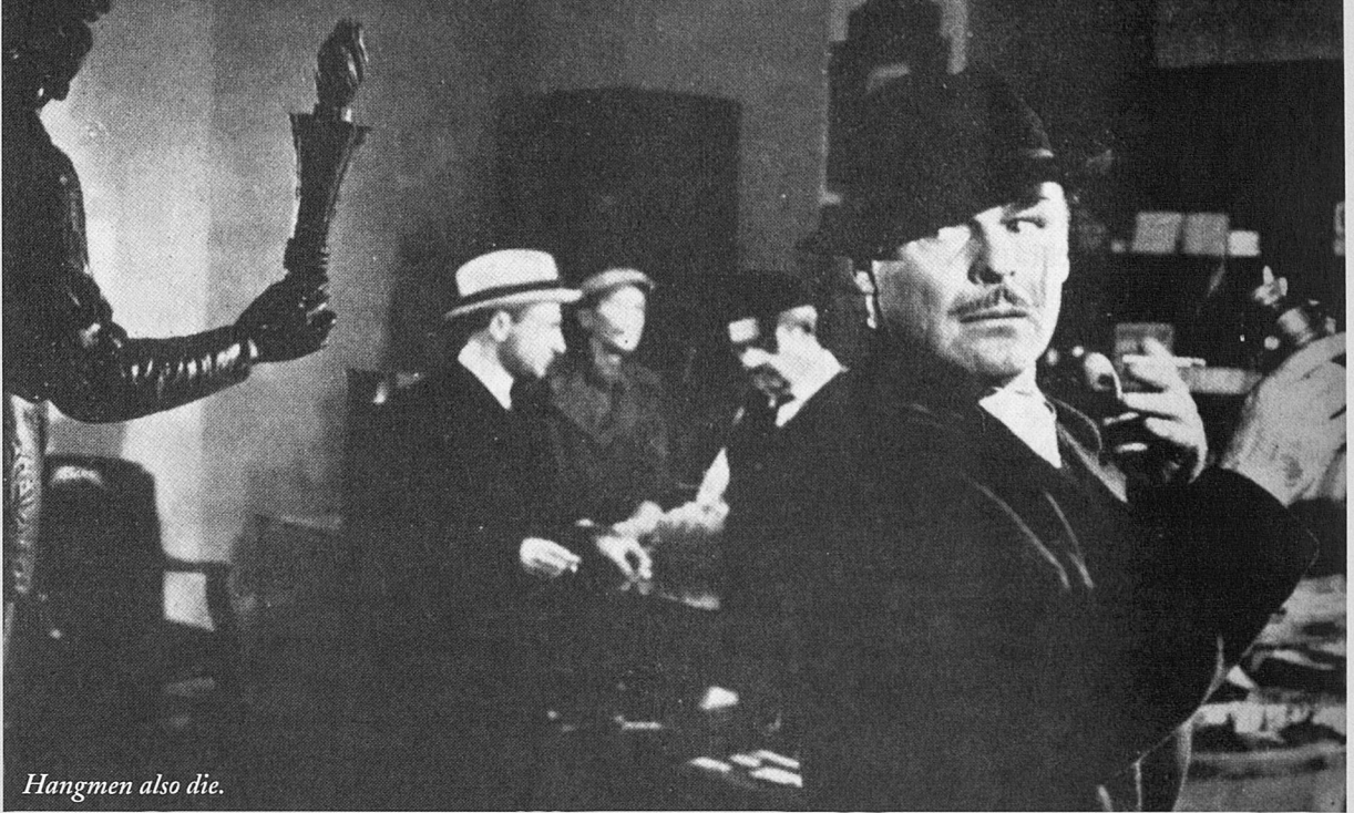
Hangmen also die.