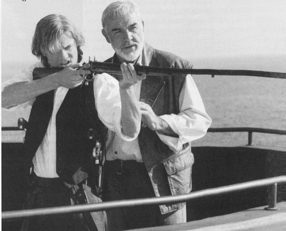
La Liga de los hombres extraordinarios.

Renée Zellweger i Ewan McGregor fan amb gràcia el que els toca fer: intercanvi de frases en doble sentit; mirades seductores i carusses, a més de ballar i moure's en decorats característics dels anys seixanta, però, recreats digitalment, volgudament artificiosos per arribar a ser captivadors. ■