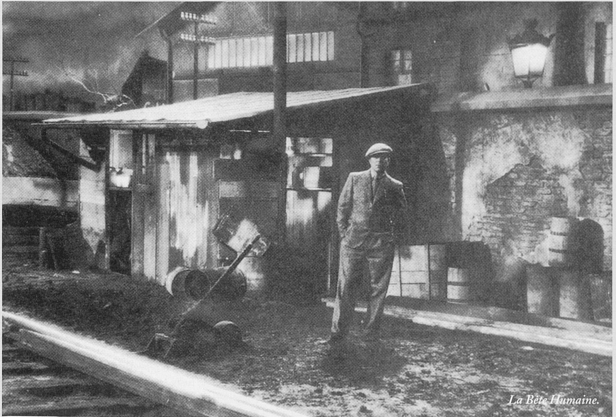
La Bête Humaine.