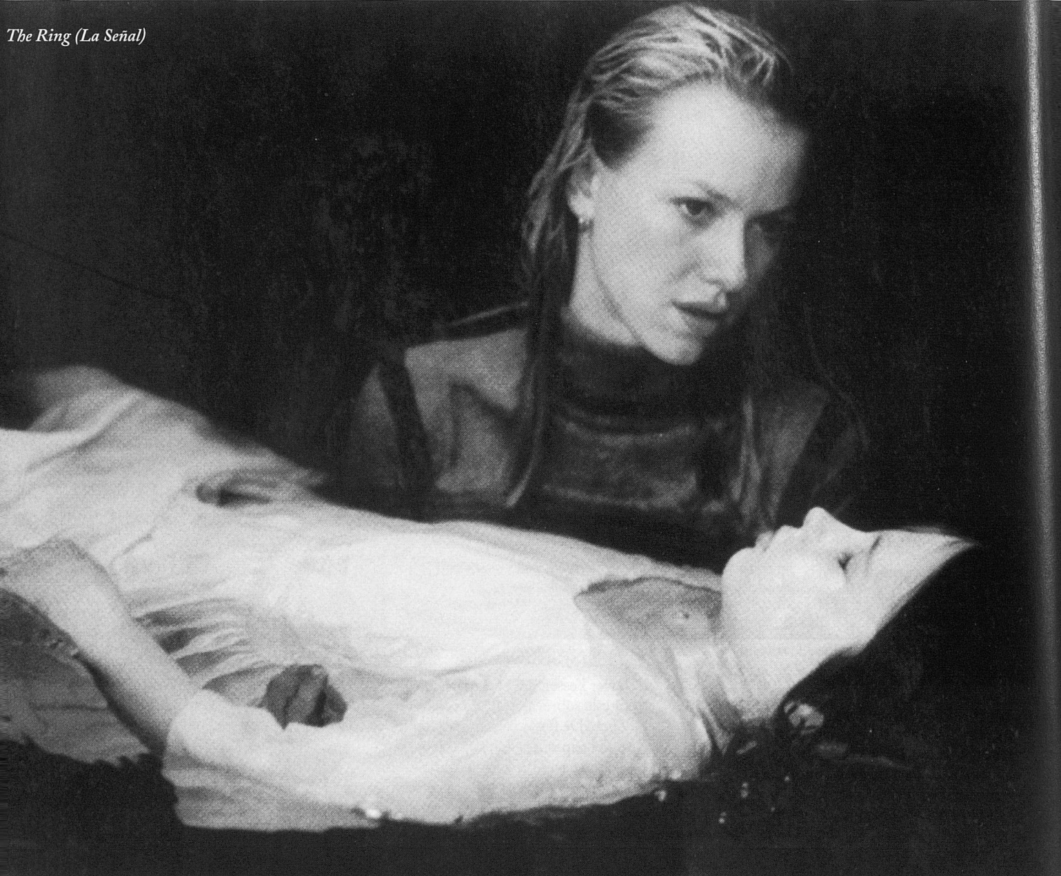
The Ring (La Señal)

A més, The Ring permet redescobrir el músic alemany Hans Zimmer, que darrerament es repetia massa en els seus altres treballs amb Ridley Scott des de Gladiator , amb una banda sonora que encaixa prou bé amb la