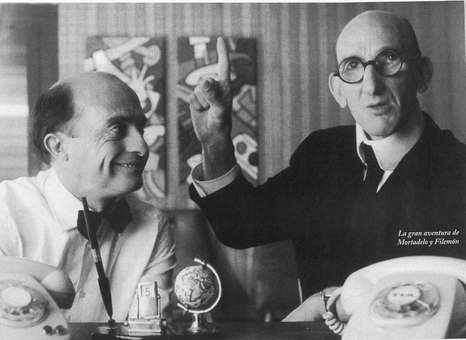
La gran aventura de Mortadelo y Filemón