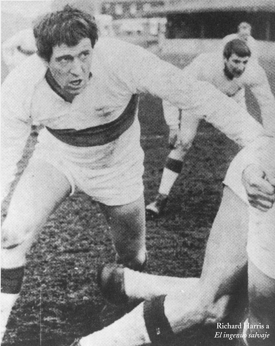
Richard Harris a El ingenio salvaje

tes de l'autor de La aventura i El eclipse . Un Richard Harris excepcional.