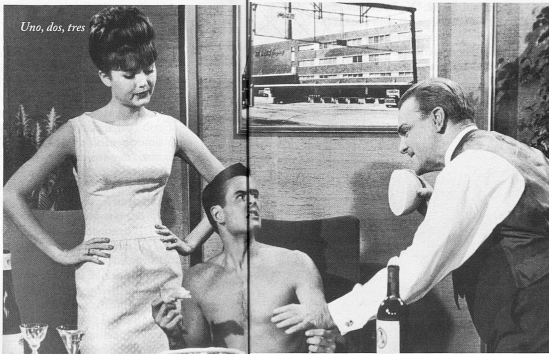
Uno, dos, tres