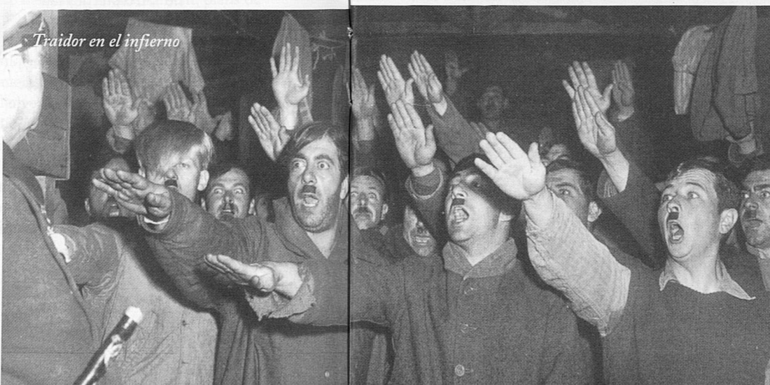
Traidor en el infierno

Straser, "l'edat d'or dels homosexuals, l'astrologia i els somnàmbuls". I certament els jocs de transvestiment i desdoblament són recurrents en Wilder. Els trobem a Uno, dos, tres , a Traidor en el infierno , a Irma la dulce ... I evidentment a Con faldas i a lo loco , pel·lícula que va comptar amb l'assessorament de Barbette, cèlebre transvestit a qui Billy coneixia de Berlín i París.