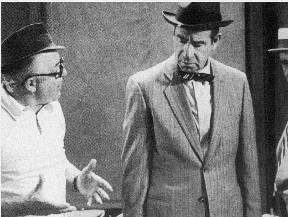
Billy Wilder dirigint a Walter Matthau.

Com podem veure, la mirada de grans directors com Wilder, Lang o Mann (recordem El dilema ) posa l'accent en la dubtosa legitimitat que tenen els mitjans que ha usat el periodisme per aconseguir aquest poder. Malauradament, són molts els que corren per les redaccions dels diaris (ja sigui dins o fora de la pantalla) disposats a vendre la seva ànima al diable. Per sort, gent com Lang, Wilder, Mann o, fins i tot, Godard, fan pel·lícules que ens serveixen de contrapunt a la submissió que busquen de nosaltres aquests perillosos "fausts" que dominen el món. ■