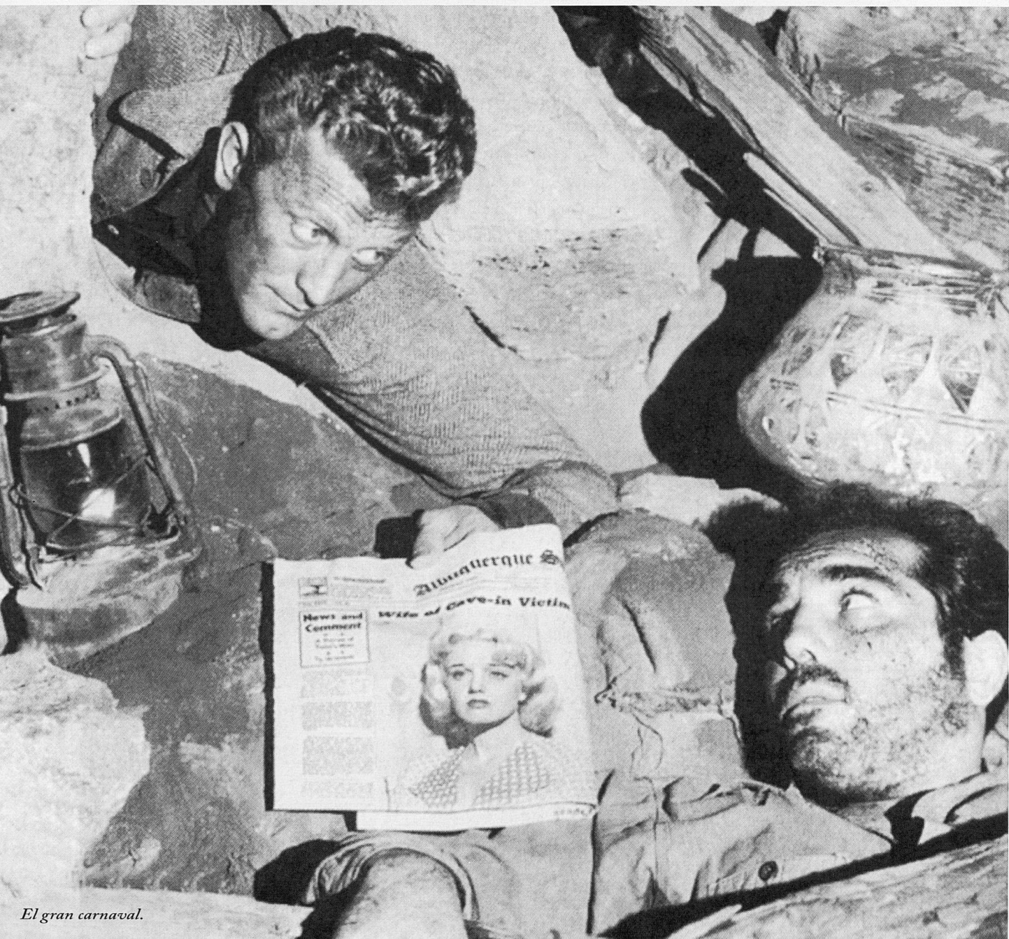
El gran carnaval.

Hi havia, en aquelles tardes dominicals i vilatanes de cinema, algunes pel·lícules que venien a posar un contrapunt de negror a aquells altres capvespres lluminosos en els quals centellejava a la pantalla el fulgor dels herois i de l'aventura. Tardes de pel·lícules negres i d'històries d'antiherois que ens descobrien els aspectes més ombrius i més sòrdids de la condició humana, tot mostrant-nos una realitat descarnada que existia a qualche indret, per sort molt allunyat, del nostre petit món. Era el d'aquella mateixa Amèrica de la qual ens arribaven les pel·lícules i que romania tan