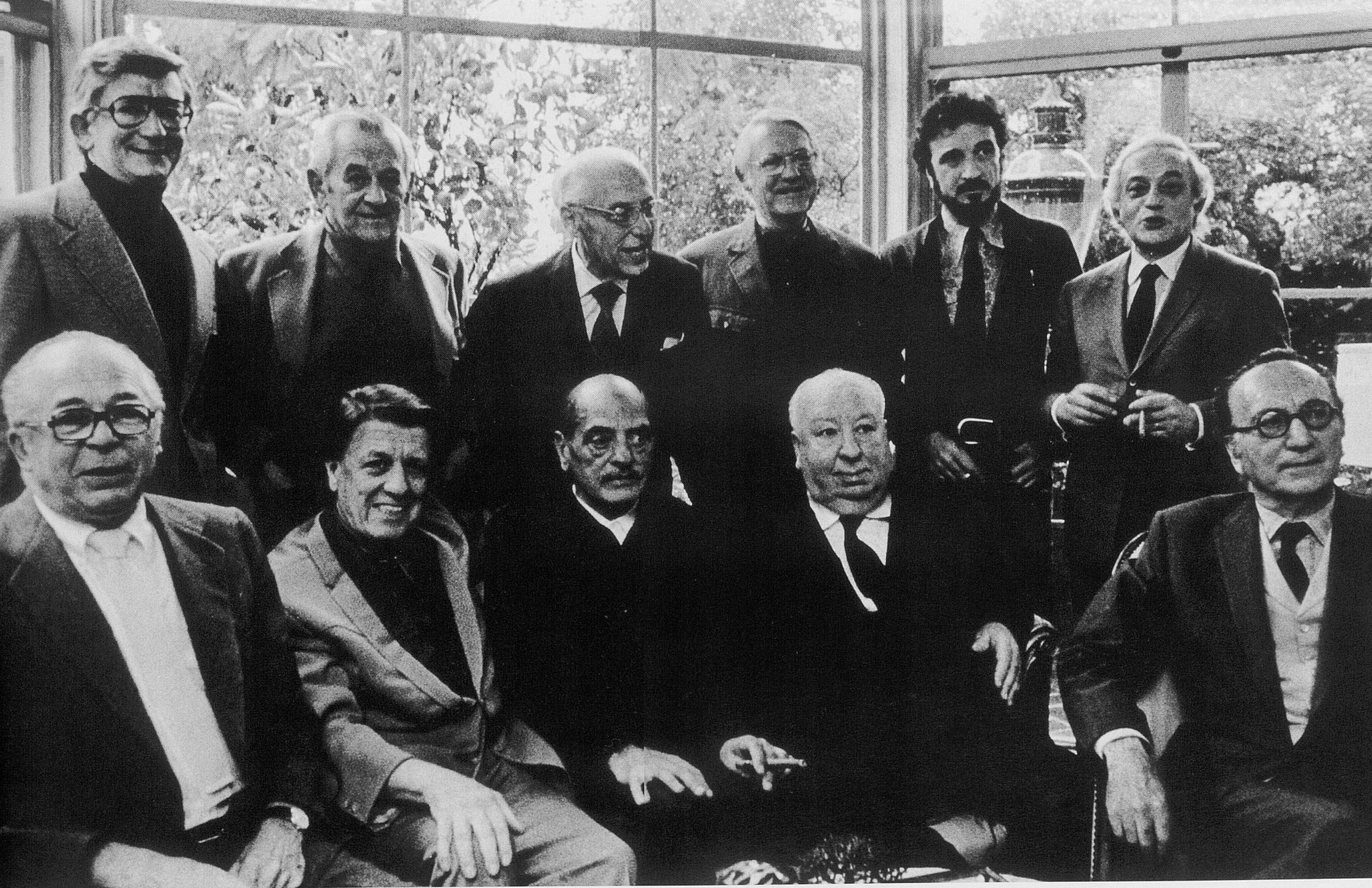
Drets: Robert Mulligan, William Wyler, George Cukor, Robert Wise, Jean-Claude Carrière i Serge Silberman. Asseguts: Billy Wilder, George Stevens, Luis Buñuel, Alfred Hitchcock i Rouben Mamoulian.