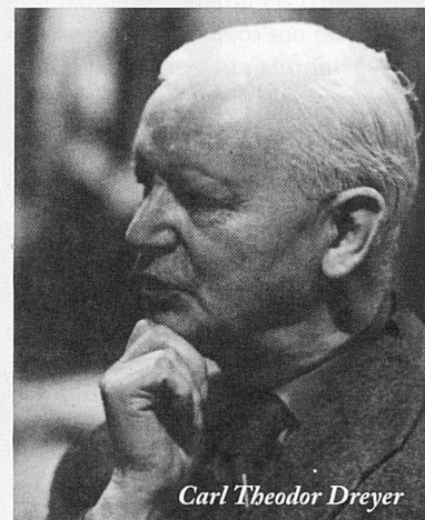
Carl Theodor Dreyer

Dies irae (Vredens dag) . Dir. Carl Theodor Dreyer, 1943. Dinamarca. Rescatam en cinema una de les obres més alabades del mestre danès. VOSE