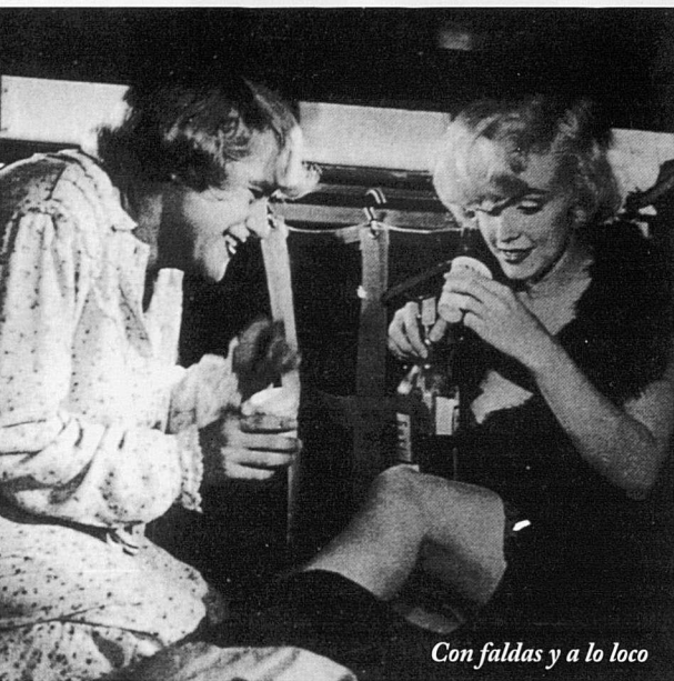
Con faldas y a lo loco

Després d'una interrupció en què l'organització del cinema club no ha tengut res a veure, el proper dijous 14 de febrer a les 21.30 h es torna a posar en marxa aquesta X temporada de projeccions regulars. Serà al Teatre d'Artà. Aquesta 2ª part oferirà deu nous títols que segueixen la línia habitual del Cinema Club RecercaPruaga d'oferir un cinema que, lluny d'intencions purament crematístiques, en cerca els caires artístics, defuig de l'estandardització i l'eurofàstic, i en fi, amb els nostres modestos mitjans, plantam cara a la globalització cine-