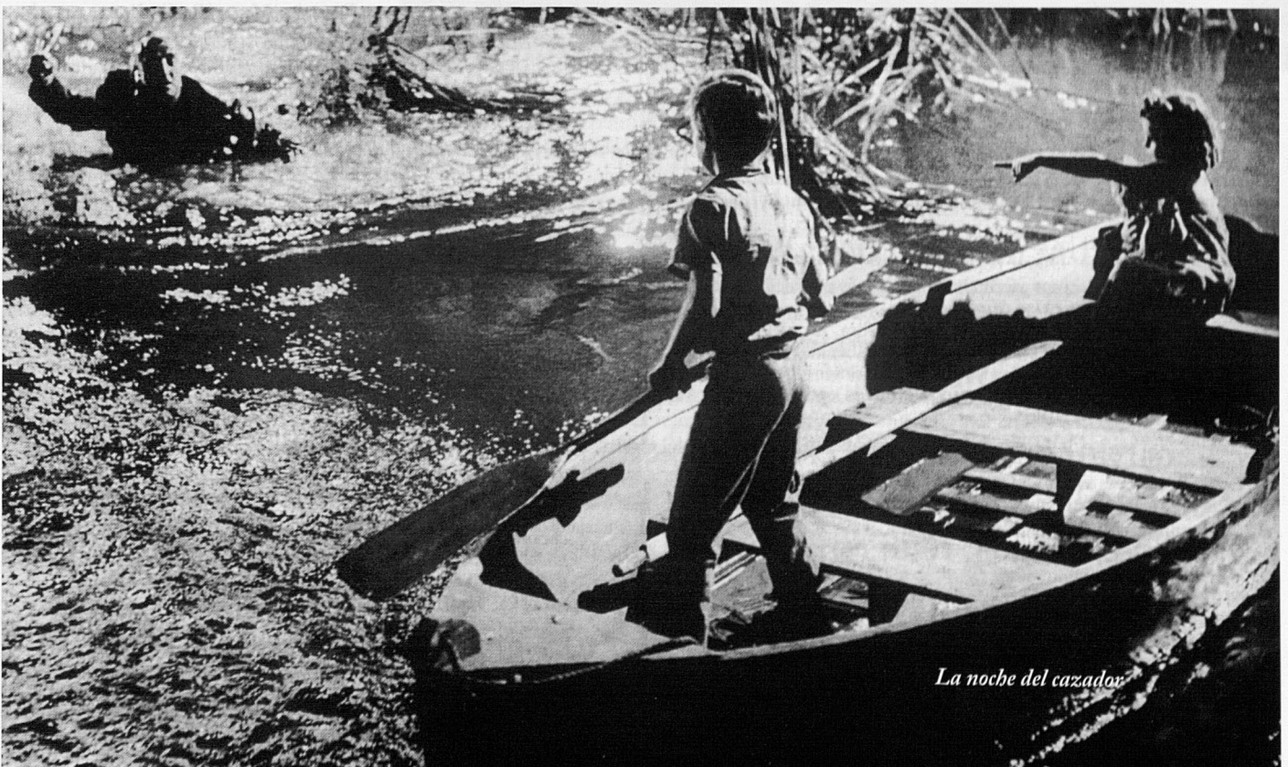
La noche del cazador