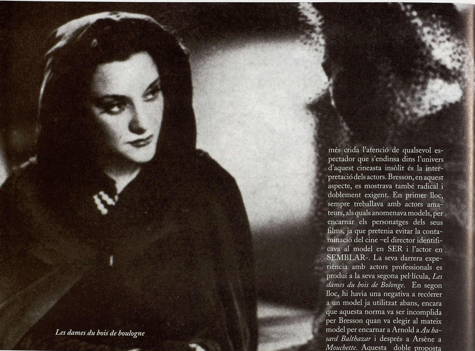
Les dames du bois de boulogne

més crida l'atenció de qualsevol espectador que s'endinsa dins l'univers d'aquest cineasta insòlit és la interpretació dels actors. Bresson, en aquest aspecte, es mostrava també radical i doblement exigent. En primer lloc, sempre treballava amb actors amateurs, als quals anomenava models, per encarnar els personatges dels seus films, ja que pretenia evitar la contaminació del cine —el director identificava al model en SER i l'actor en SEMBLAR—. La seva darrera experiència amb actors professionals es produí a la seva segona pel·lícula, Les dames du bois de Boulogne . En segon lloc, hi havia una negativa a recórrer a un model ja utilitzat abans, encara que aquesta norma va ser incomplida per Bresson quan va elegir al mateix model per encarnar a Arnold a Au hasard Balthazar i després a Arsène a Mouchette . Aquesta doble proposta queda perfectament anunciada en un dels aforismes de Notes sobre el cinematògraf : “Admetre que X sigui a vegades Atila, Mahoma, un empleat de banca, un llenyataire, és admetre que X actua. Admetre que X actua és admetre que les pel·lícules en què actua s'emparenten amb el teatre. No admetre que X actua és admetre que Atila= Mahoma =un empleat de banca = un llenyataire, i és absurd”.