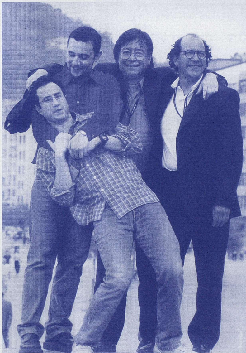
Part de l'equip de Taxi para tres .

rer any (dins aquesta secció el festival ha servit com a presentació de l'excel·lent film mexicà Y tu mamá también d'Alfonso Cuarón); i finalment hi ha hagut una secció que sota el nom de Sucedió ayer ha fet un repàs a través de moltes i variades pel·lícules dels fets més rellevants del segle que hem acabat.