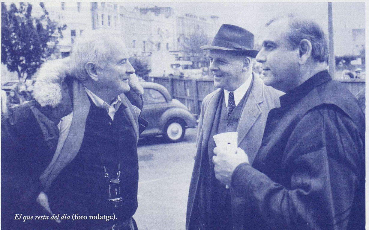
El que resta del dia (foto rodatge).

En tots els tres casos tot just acabats de veure, sol haver-hi un acte de rebel·lió contra l'estat d'autòmat: el final de gran part de les pel·lícules que tracten aquesta temàtica sol ser que el personatge que actua de forma maquina s'allibera d'aquesta situació i esdevé, finalment, més humana. A més, aquest acte d'alliberament sovint sol ser remarcat per una acció concreta que assenyalava que la persona és conscient del que fa i que vol deixar-ho tot enrere: és la crema del full on hi ha escrites les normes a The Cider House Rules ; és perdonar la neboda de la mort a The Searchers o el darrer ball que fan alumne i professora a Shall We Dansu? ■