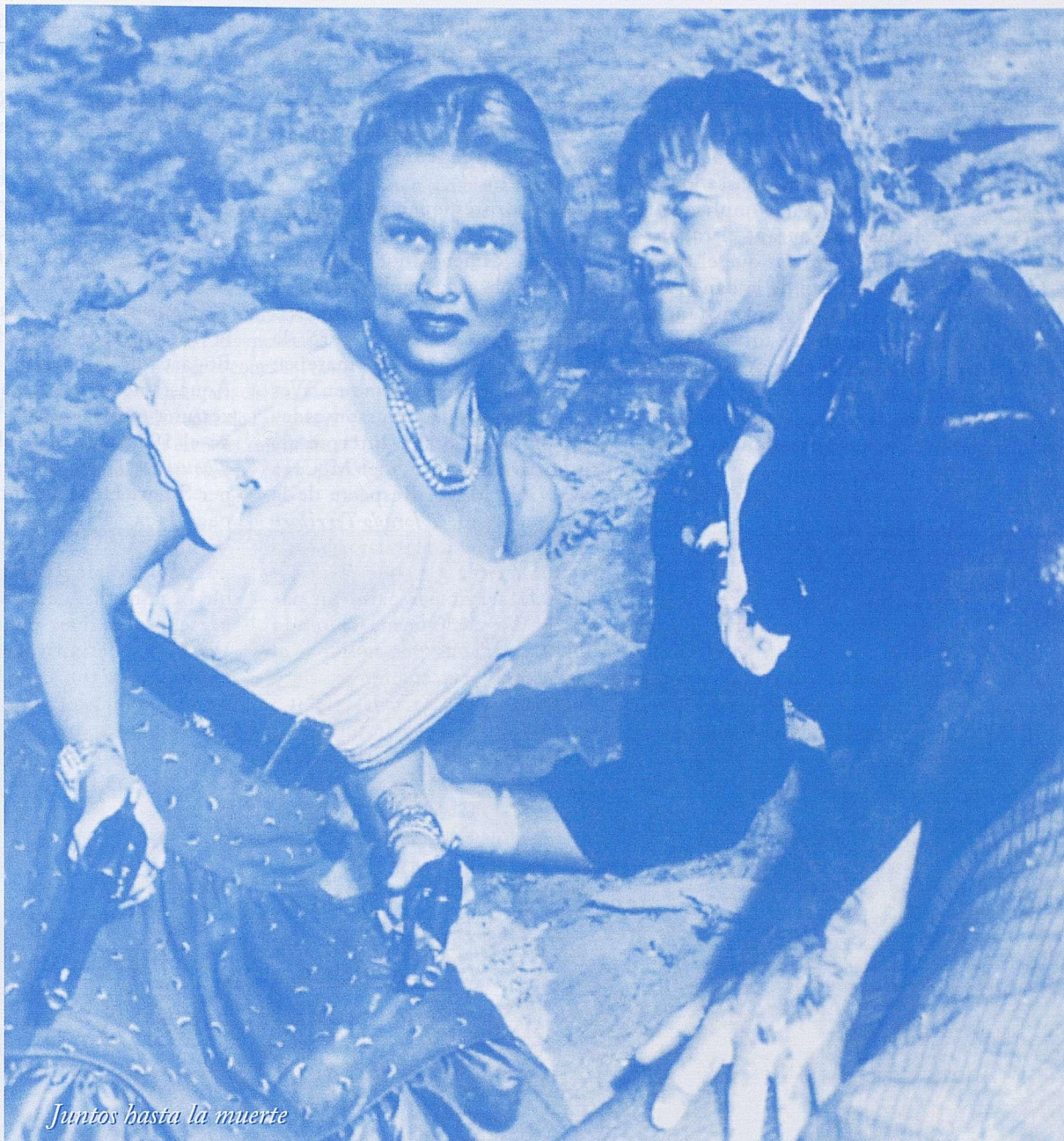
Juntos hasta la muerte

L'article anterior acabava dient que aquest tractaria sobre l'etapa de formació de Raoul Walsh durant els trenta primers anys del segle XX, però ordres cabalístiques superiors obliguen a postergar aquest tema per al tercer capítol. Aquest segon lliurament parla en concret de dues pel·lícules de Raoul Walsh que mantenen un vincle molt estret entre si, a part de ser