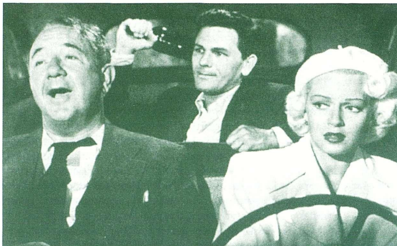
El cartero siempre llama dos veces.

marcat per les pel·lícules que descriuen l'ascens i caiguda, inevitable, de personatges rellevants de la màfia, un conjunt en què destaquen The Roaring Twenties ( Los violentos años veinte , Raoul Walsh, 1939) i Scarface (Howard Hawks, 1931).