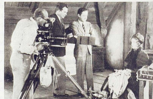
King Vidor dirigint La Bohème

1959. Amb el remake de Ben-Hur de William Wyler, la Metro va voler recuperar un dels seus èxits fundacionals. El resultat va ser espectacular: amb una inversió de quinze milions de dòlars a la nova adaptació del llibre de Lew Wallace, la Metro va tenir uns guanys de vuitanta milions i va aconseguir el rècord de dotze Oscars.