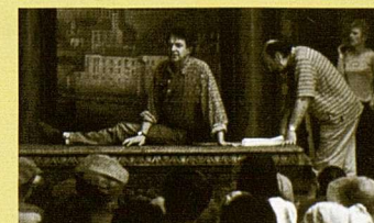
Shakespeare in love, de John Madden