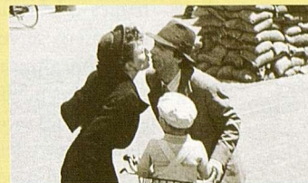
La vida es bella, de Roberto Benigni