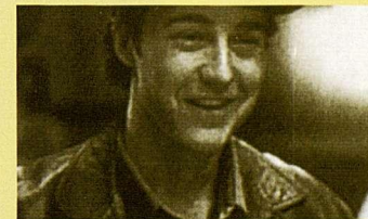
American History X, de Tony Kaye