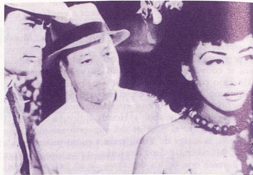
El perro rabioso