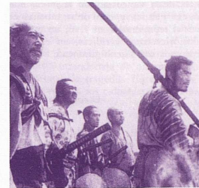
Los siete samurais

Inquieta per la seva precisió aquesta mirada sobre Macbeth de Kurosawa. Una de les seves pel·lícules més aconseguides, dotada d'un ritme i una posada en escena sense concessions, que manté l'espectador atrapat en aquesta atmosfera feta de mesclar la espectacularitat de les seqüències exteriors en el bosc i de donar als personatges una direcció sense ambigüitats que a vegades arriba a claparar per la seva claredat. Recordar per sempre la seqüència de les qualcades dels cavallers dins els boscos plens de boira i la seqüència final de la pel·lícula.