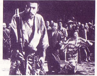
Los siete samurais

Per destacar-ne algunes, de les pel·lícules d'aquest director mort el passat mes de setembre, citaria sense dubtar Rashomon , Trono de sangre i Dersu Uzala . Obres molt diferents entre si, però que donen una mesura bastant adequada del ventall creatiu del seu realitzador. Si haguéssim de concretar, potser escolliria com a testament Dersu Uzala , ja que ens seria més fàcil connectar l'obra amb la personalitat de Kurosawa. Aquesta faula d'un home petit que domina l'entorn i la naturalesa que l'envolta, i que és capaç de trobar-se còmode a la civilització, ens permetria parlar amb més precisió de la trajectòria de Kurosawa: un cineasta que alternava i fonia imatges de gran bellesa i seqüències de molta espectacularitat