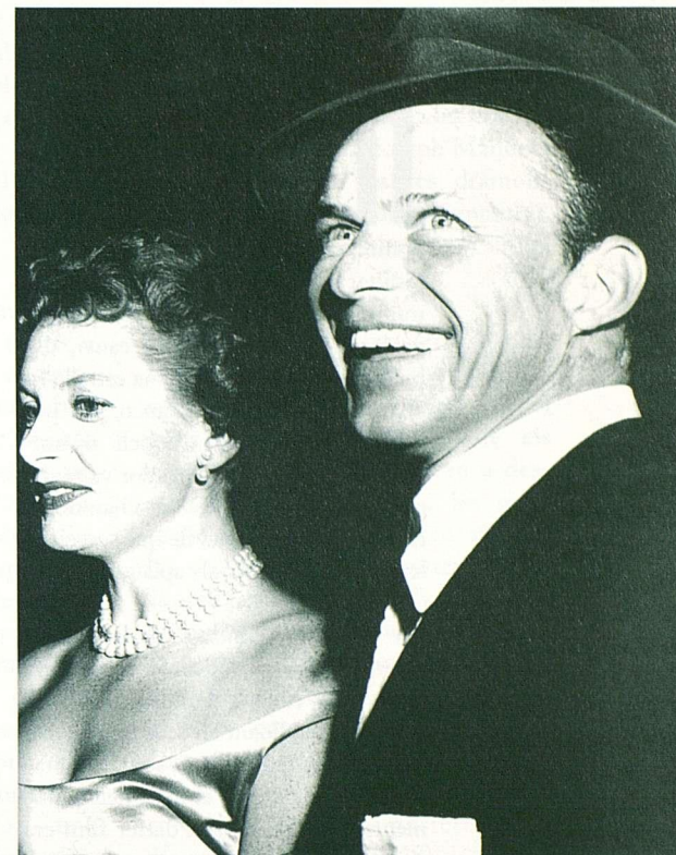
Frank Sinatra i Deborah Kerr

I, per damunt de totes, recordem com mereix, com la de tota la resta d'actors del film, la interpretació de Sinatra a Como un torrente , excepcional melodrama de Vincente Minnelli (i una de les més assumides debilitats cinematogràfiques de qui això subscriu), basat en una mediocre novel·la de James Jones, en el qual un veterà de l'exèrcit torna a la seva ciutat nadiua -Indiana- on, arrossegat per un desengany i per un sentiment de fracàs professional com a escriptor, coneix un jugador alcohòlic: Bama (inoblidable Dean Martin, el mateix any que interpretava un altre alcohòlic per al record, Dude, a Río Bravo de Howard Hawks), i a una al·lota de províncies transformada en entranyable prostituta, de la qual Shirley MacLaine, com a Ginny, ens va oferir una interpretació absolutament genial, a l'alçada de les més aconseguides amb Billy Wilder ( El apartamento , Irma la dulce ).