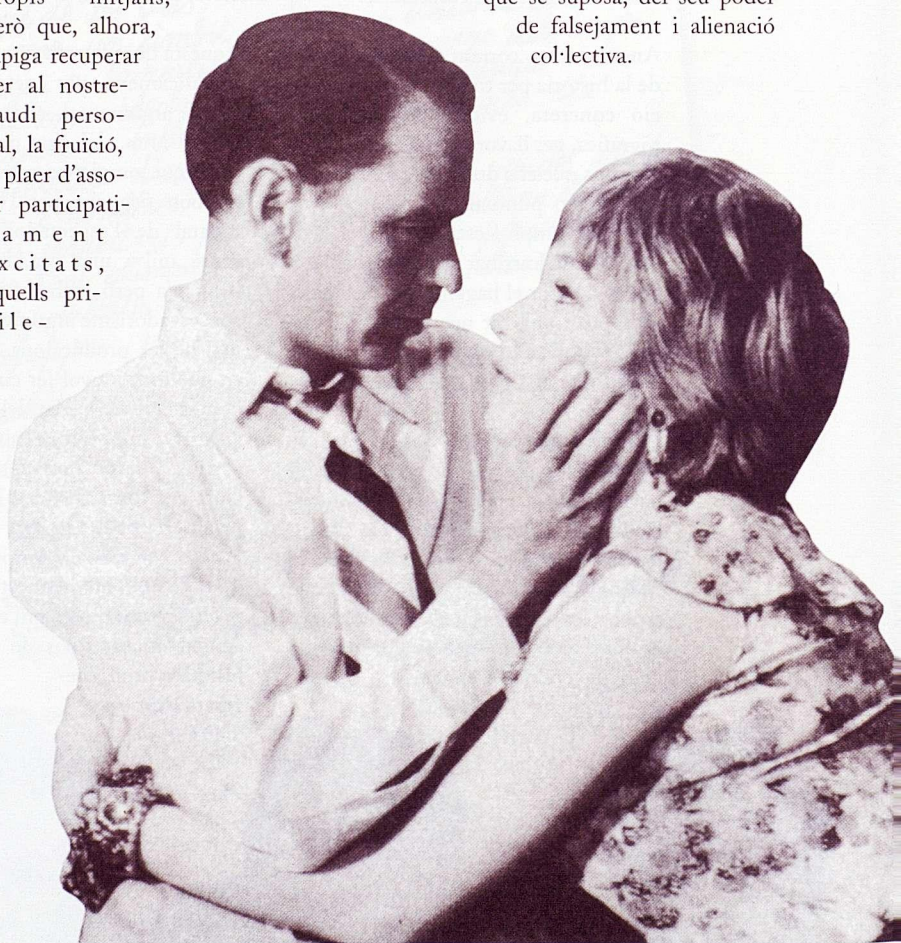
Como un torrente

Als convençuts que s’ha de desmitificar el cinema per tal de poder reeducar l’espectador, els record que, per a nosaltres, que ens hem passat la vida mitificant les dones, els llibres i les pel·lícules, potser amb la intenció secreta d’alliberar-nos de la desmitificació constant del temps i de la mort, el caràcter mític del cinema deriva de la seva capacitat de recreació i enriquiment del món real, i no, contra el que se suposa, del seu poder de falsejament i alienació col·lectiva.