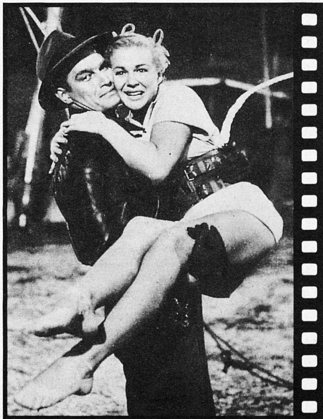
CHARLTON HESTON I BETTY HUTTON