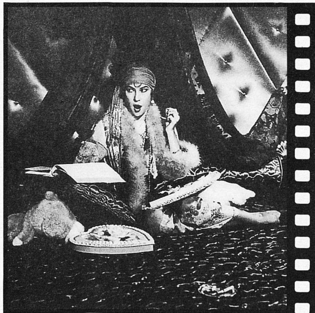
FOTOGRAMA DE BALAS SOBRE BROADWAY

més de traslladar a la pantalla aquest inqüestionable clàssic del teatre modern, ha rodat una pel·lícula que és una declaració d'amor al teatre mateix: començant per l'escenari, un vell teatre de Nova York a punt de caure (que la Walt Disney Productions ha adquirit per a restaurar-lo) i continuant per una posada en escena sense decorats ni vestuari ni res: només actors (i quins actors!) en la pell de Vania i tota la seva estranya família, tot aprofitant una versió del director teatral André Gregory (que hi surt; fent de director de teatre) i els diàlegs adaptats per David Mamet (un dels més potents autors teatrals nord-americans de la segona meitat d'aquest segle).