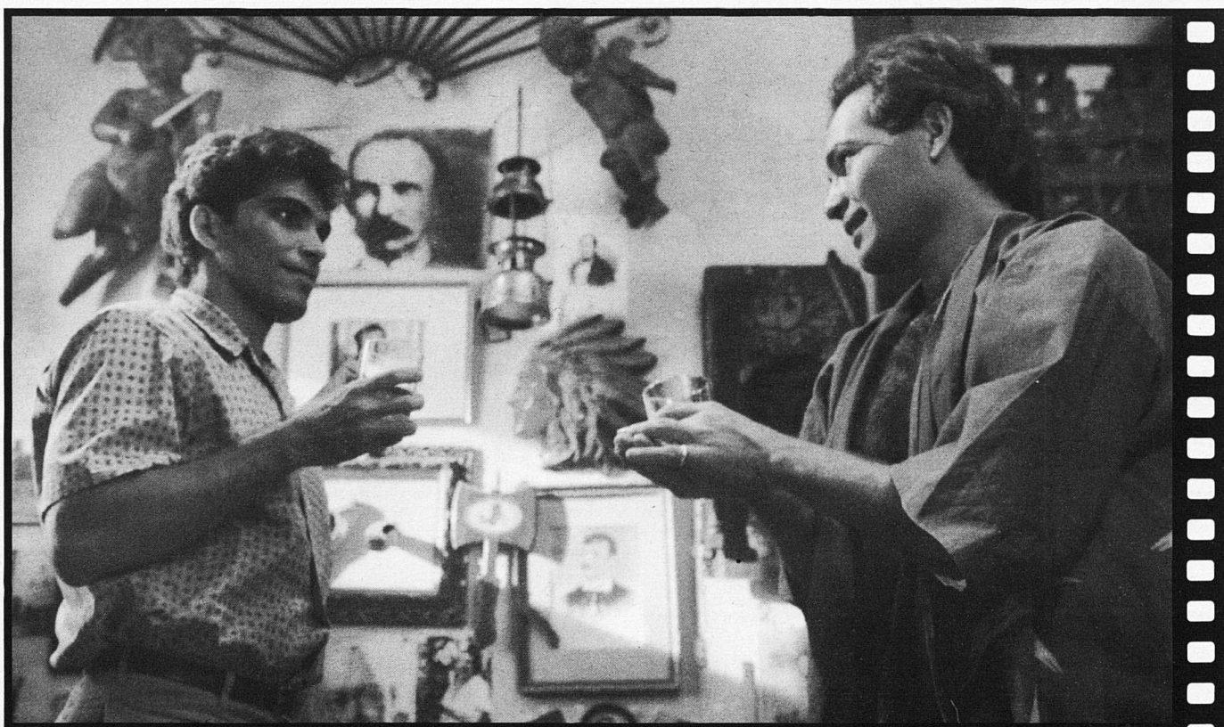
FOTOGAMA DE FRESA Y CHOCOLATE

L'«assumpte gai» a Cuba, el maldestre tractament que les autoritats d'un govern centralista com pocs va donar als homosexuals, va quedar reflectit a la pel·lícula amb tant de risc com tacte per denunciar els efectes d'una intolerància que es va transvestir de "política cultural" i va conformar