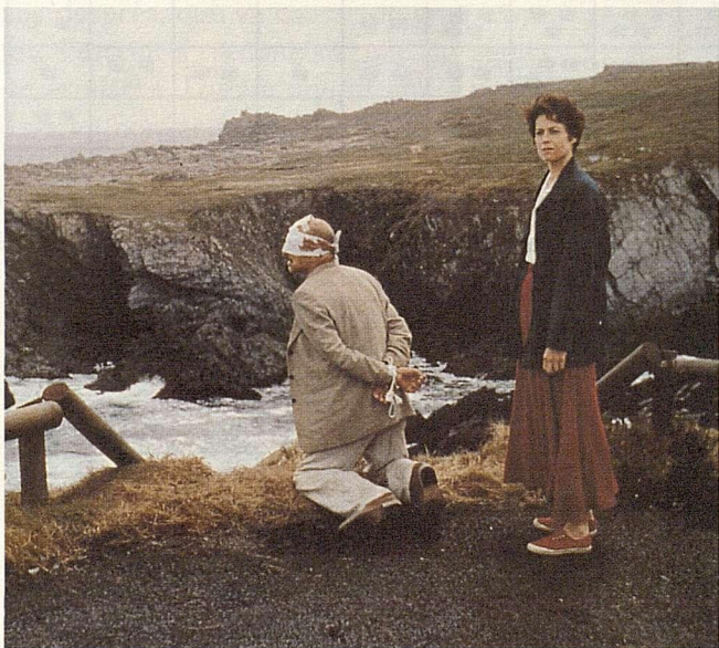
FOTOGRAMA DE LA MORT I LA DONZELLA