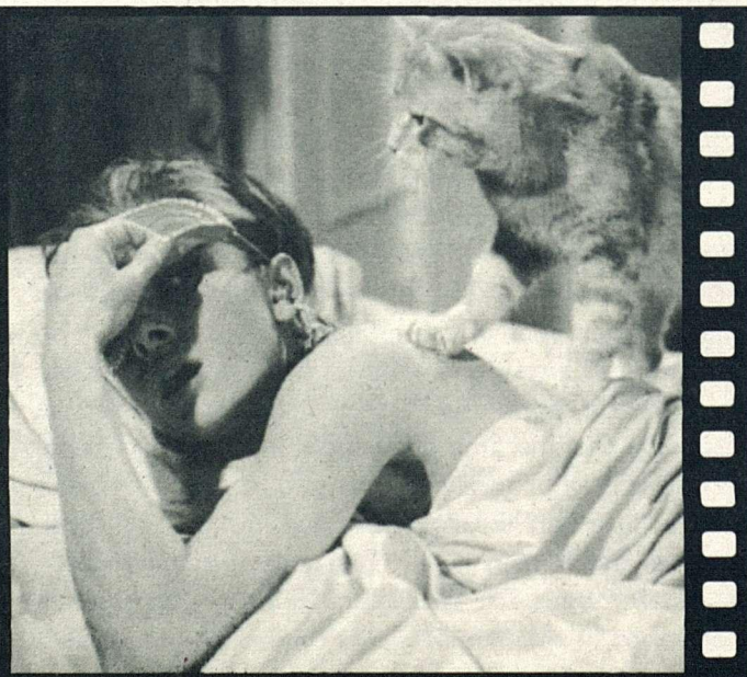
AUDREY HEPBURN A DESAYUNO CON DIAMANTES : IMAGINAU-VOS EL COLL QUE EL MOIX ESTÀ MIRANT