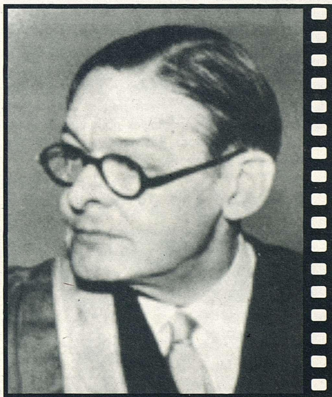
THOMAS STEARNS ELIOT