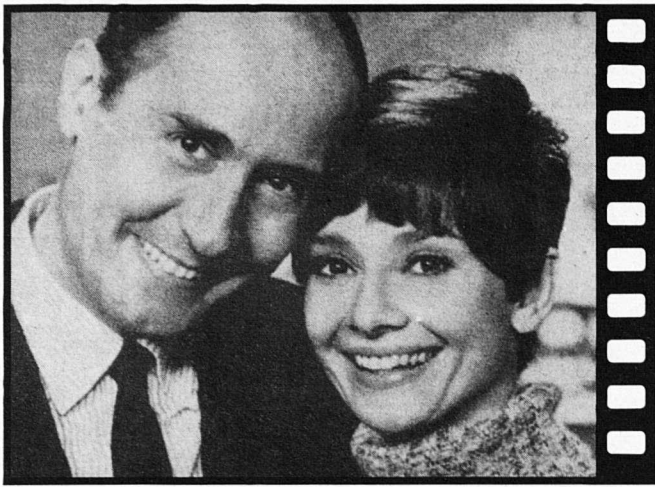
HENRY MANCINI I AUDREY HEPBURN