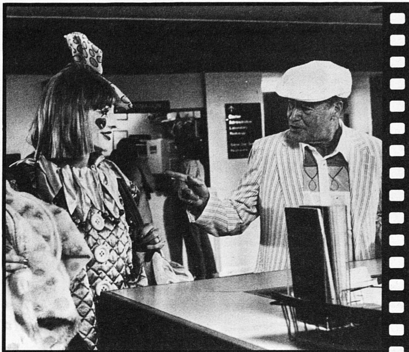
FOTOGRAMA DE DE SHORT CUTS . VIDAS CRUZADAS DE ROBERT ALTMAN

En el fons, aquest mosaic està format per nombroses peces que ens recorden una situació pròpia pròxima a les nostres vides, o no molt llunyana. Per això, els personatges no tenen malícia, són la conseqüència d'una cultura, d'un moment social i arrossegueu al seu darrera el pes d'una jove nació que ha entrat en crisi fins i tot abans d'haver assolit la maduresa. Des de la cambrera que atropella inconscientment el nin, o els pescadors que no denuncien l'aparició d'un cadàver per no espanyar egoïstament la seva excursió amb el pretext que ja no es pot fer res, i fins i tot el netejador de piscines àvid de sexe que matarà una ciclista adoles-