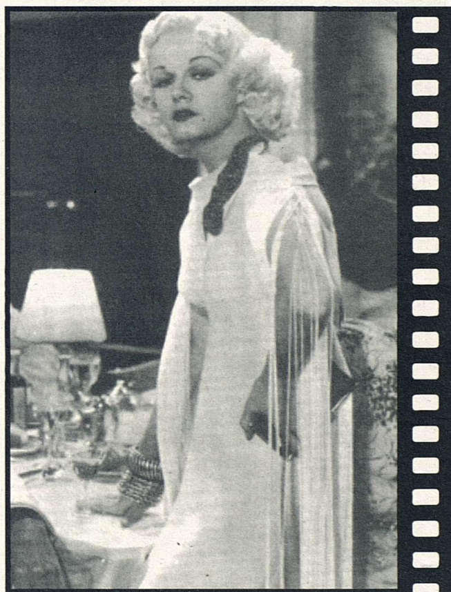
FOTOGRAMA DE CHINA SEAS (1935)

16 / 11 Judge priest . John Ford. (EUA, 1934).