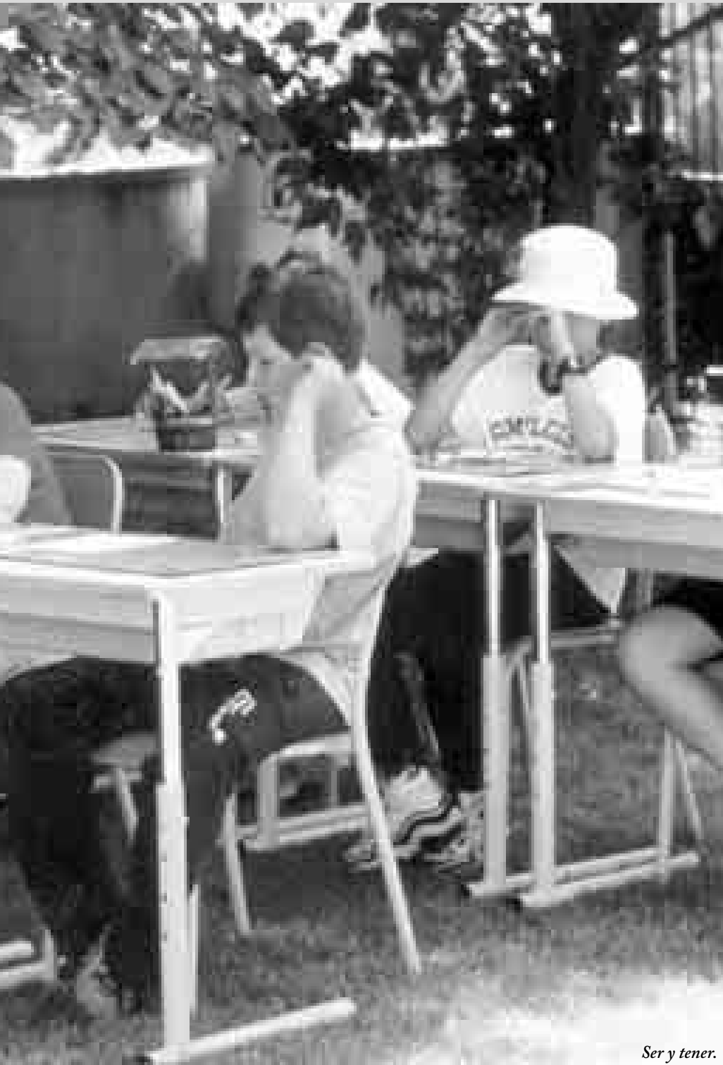
Ser y tener.

Si seguim el principi ineludible que cal aplicar-li a qualsevol pel·lícula, i que consisteix a establir un doble diàleg amb la realitat que l'envolta i el cinema, és ben cert que Ser y tener hauria de ser de visió obligada, en la mesura que és una lliçó sobre l'educació dels nens —anàlisi concisa i precisa de la relació mestre-alumne— i una lliçó de cinema —de quina manera cal observar la realitat, quines actituds i distàncies cal adoptar-hi, com intervenir-hi—. Només d'aquesta manera es pot obtenir el resultat d'un testimoni valuós, un document revelador, en definitiva una bellíssima pel·lícula que implica l'espectador de manera lliure. Tan sols així es pot esperar la resposta emocionada quan el professor Georges López s'acomiada, definitivament, dels seus alumnes, xalestos perquè comencen les vacances. 🎬