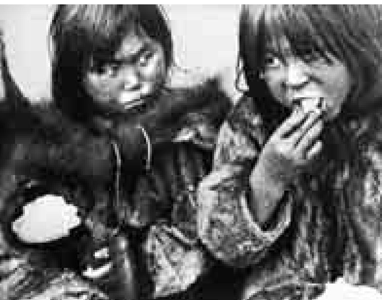
Nanuk, el esquimal.

A diferència de com ho va fer Costa-Gavras per contar-nos la història (fictícia, però amb intencionades referències reals a més d'un clar posicionament ideològic) de l'assassinat d'un diputat d'esquerra a la pel·lícula Z (1969), Omagh s'estalvia aprofundir en les qüestions polítiques que varen motivar l'atemptat. La pel·lícula que dirigeix Travis es limita a adoptar el punt de mira dels familiars de les víctimes (catòliques i protestants per igual) per denunciar la ràbia i el desemparament que pateixen al ser utilitzats com a moneda de canvi per les autoritats polítiques d'ambdues parts. És a dir, Omagh condemna tant la mort dels innocents, que va provocar la bomba col·locada amb premeditació al centre comercial de la ciutat perquè explotàs en hora punta, com la desídia de les forces de seguretat, que varen rebre un avis de bomba i no varen actuar amb l'eficàcia que se'ls exigia. Amb tot, la pel·lícula també inclou una mínima aproximació psicològica al treure a la palestra (sense caure al melodrama) els conflictes i el distanciament familiar que apareix entre aquells membres que es resignen a acceptar i plorar les pèrdues, enfront d'aquells altres que se submergeixen en l'activisme més fervent com a "refugi" per no haver d'enfrontar-se amb l'absència. ■