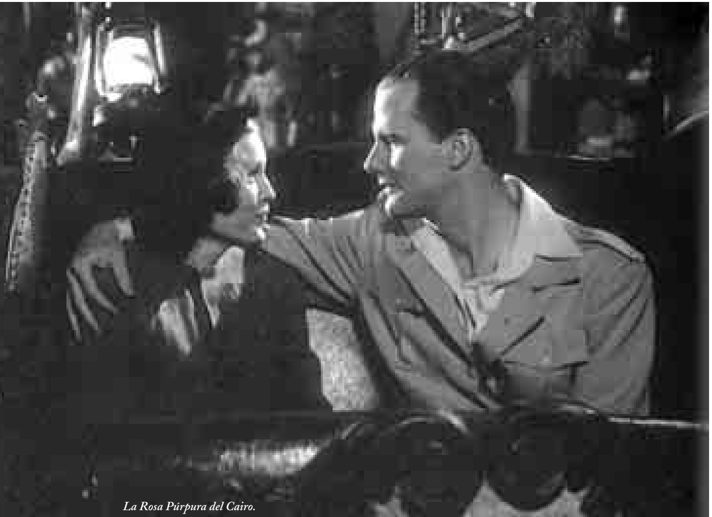
La Rosa Púrpura del Cairo.

Pot semblar una bajanada, però si els que creen una obra d'art ho fan amb l'esperit que se posa quan s'omple una instància administrativa, és a dir, pensant únicament amb el resultat pràctic, i manquen de la fruïció de fer-la, l'espectador la percep com el que realment és, una simple instància administrativa, el més allunyat que pot haver-hi del que ha d'esser l'art