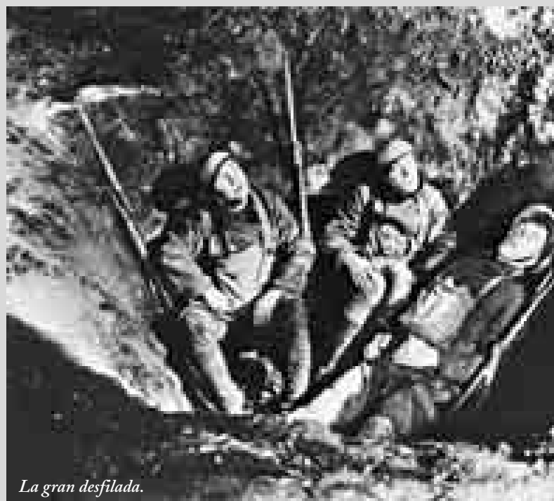
La gran desfilada.

Titulà la seva biografia Un arbre és un arbre . Tal vegada sigui difícil trobar amb més encert un adjectiu que s'ajusti més a la moral que hi havia darrere la seva càmera: la claredat abans de res. 🎬