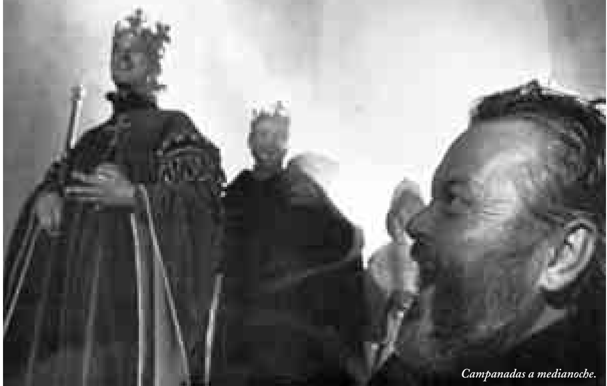
Campanadas a medianoche.

nang convertirà un nou Enric V (1989) en un cant nacionalista per a major glòria de la nació britànica i de la seva consuetudinària monarquia. Després, entossudit en demostrar que l'humor britànic és humor universal i que la grandesa de Shakespeare permet les més variades ambientacions històriques i estètiques, dirigità també la deliciosa comèdia Molt de soroll per res , (1993) traslladada al segle XIX, un segle en el qual situarà també i uns anys després la seva versió de Hamlet (1996), feta d'una monumentalitat i grandiloqüència excessiva, que contrasta amb la senzillesa amb què filma In the Bleack Midwinter (1995), nova obra shakespeariana que convergeix en un homenatge al teatre, als seus usos i costums escènics, als seus modes interpretatius i a la inventiva i enginy que el millor teatre inclou com una senya d'identitat. Encara l'afany per fer baixar del parnàs literari a l'autor dels seus amors i acostar-lo al públic tan dispers, tan voluble i tan superficial d'avui, el durà a traslladar a la pantalla una nova comèdia, Treballs d'amor perdut (1999).