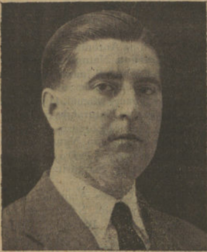
D. MIGUEL PUIG MORELL Secretario del partido Republicano Conservador

1. a La situación actual es sumamente confusa. Sin embargo, cabe dividir a los españoles en dos grupos: el de los adversarios del régimen y el de los que lo aceptan por convicción o por creerlo necesario para España.