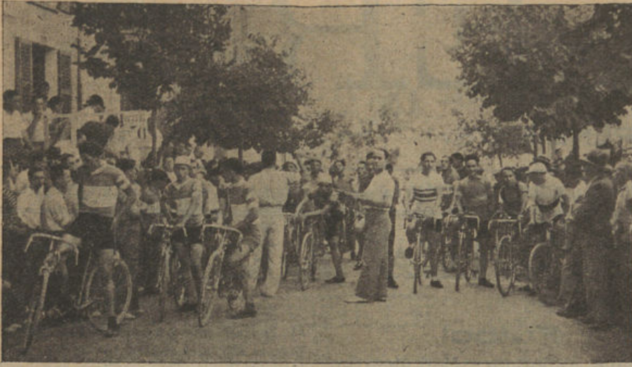
Momento de disponerse los corredores para la salida