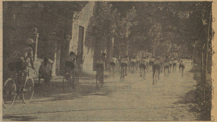
El pelotón de corredores a su paso por la calle de Cetre