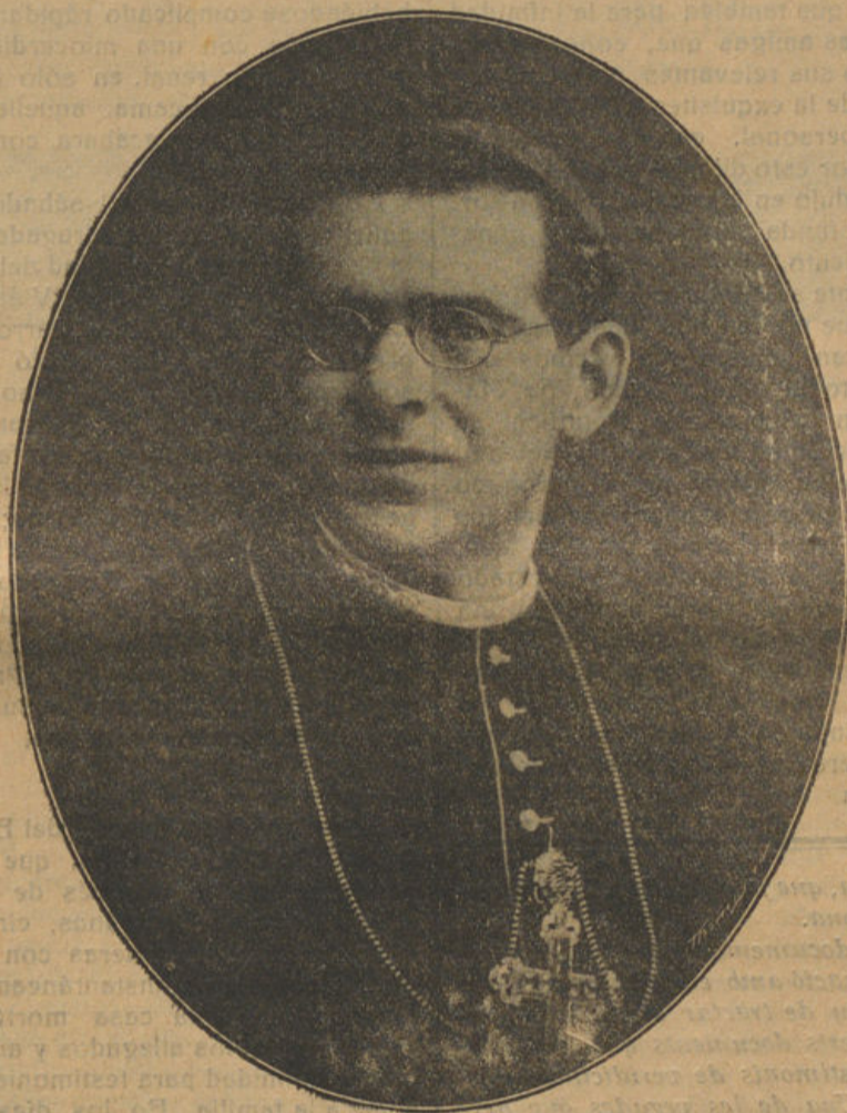
El ilustre sollerense P. Mateo Colom Canals, cuyo fallecimiento, acaecido en esta población el sábado último, lloran en estos momentos la Iglesia española y su pueblo natal.

Sóller, ante la pérdida irreparable de su hijo predilecto, siente la magnitud de la desgracia que le aflige, percibe el vacío que deja entre nosotros el Obispo estimado y llora con sus deudos y sus feligreses su eterna separación. Que sus trabajos y sinsabores hallen cerca de Aquel a quien iban dirigidos el premio a qué se hizo acreedor, iluminado por la luz perpetua de los elegidos para que, desde allí, pueda seguir velando por su pueblo que tanto quiso y de quien fué siempre entrañablemente correspondido.—M. M. C.