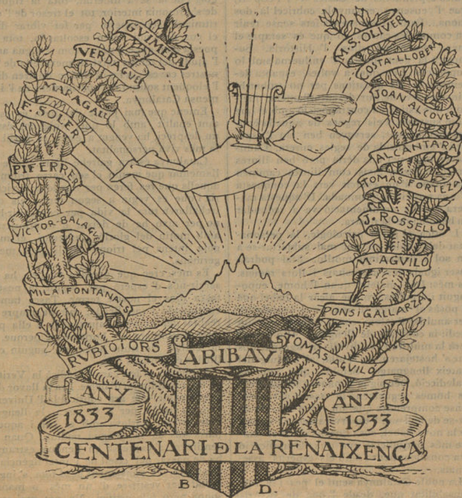
Dibuix de Bracons-Duplessis.

L'enyorança—o sentimentalitat dinàmica del record—colora els orígens, la gestació i el descabdellament de tota renaixença. L'home o el poble que més posseís, no po- dria aspirar a quelcom de superior, no po- dria subsistir sense enyorança. Però cal, a tal fi, canviar el signe negatiu d'aquest sen- timent en signe afirmatiu. Diu Goethe: tota nostàlgia veritable ha d'ésser agullonada cap a una finalitat inaccessible. La memò- ria suscita l'enyorança i l'empenta vital transposa l'enyorança del passat al futur; l'enyorança llavors suscita l'impulsivitat, la pruija de superar-se, el ressorgiment de la personalitat. Només així m'explico com tota renaixença, que és futurisme, comenci per tristos elegiaques, plors damunt les tombes, i esguards i llàgrimes vers el passat. Sort que el passat provoca recances; si pro- voqués satisfaccions i joies, tot el procedir dels homes, tota la història de la humani- tat seria ben altra. Però el passat és sempre melangiós i per això la joia només pot refu- giar-se en el futur. Així, aquest mecanisme psicològic operant en cadascú de nosaltres com en les col·lectivitats, ens mou indefec- tiblement cap endavant, i tenim sempre una esperança, i construïm història nova amb les ruïnes del passat. La Recança és transfigura en Prometença i la Crònica en Evangeli.