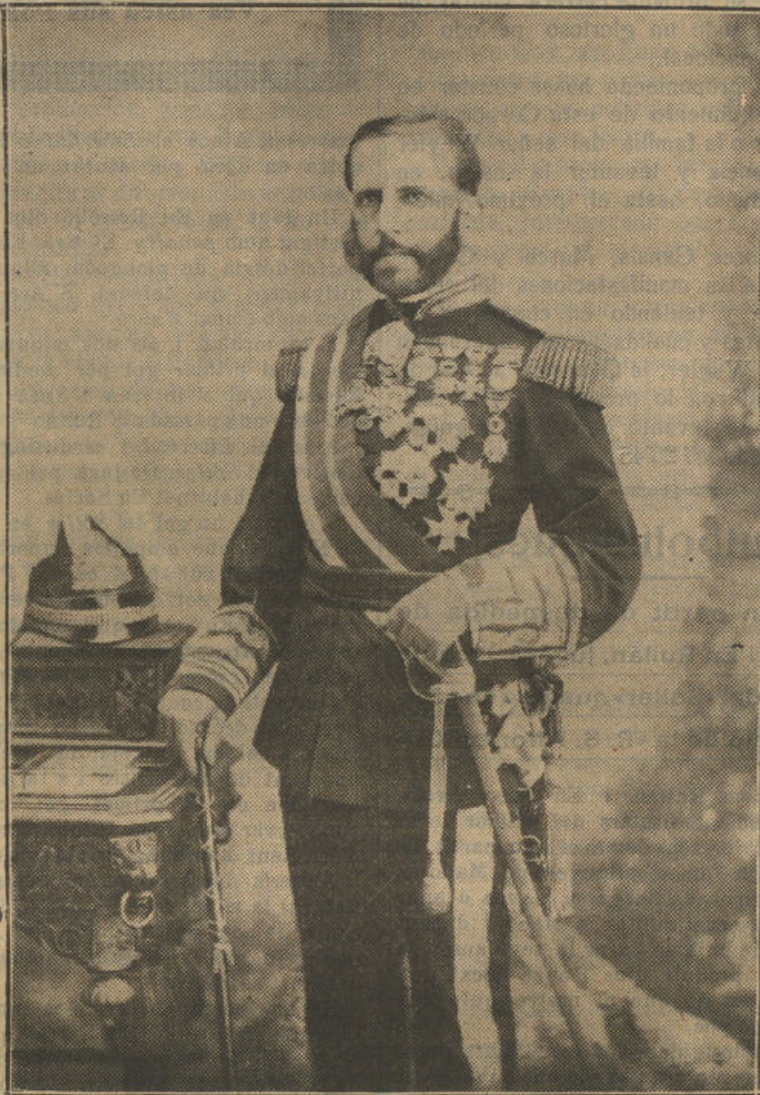
Excmo. Sr. D. Valeriano Weyler y Nicolau Capitán General del Ejército, Marqués de Tenerife y Duque de Rubí, en la época de su vida en que ejerció el mando de la Capitanía General de Baleares, cuando su venida a Sóller en 1884

«Durante todo el periodo de la Dictadura estuvimos tal vez más unidos que nunca; para derribar a la Dictadura siempre estaba dispuesto».