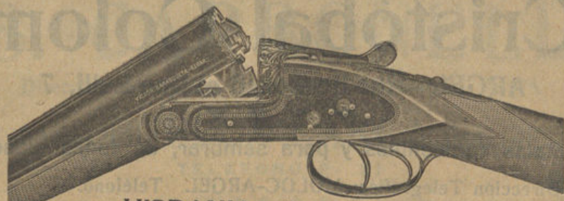
HISPANIA Creación de la casa

Representación en Sóller SAN BARTOLOMÉ, 12