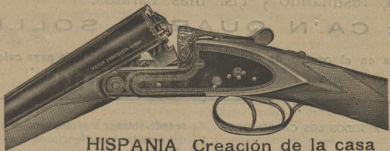
HISPANIA Creación de la casa

Con esta arma vencerás la impotencia y la debilidad