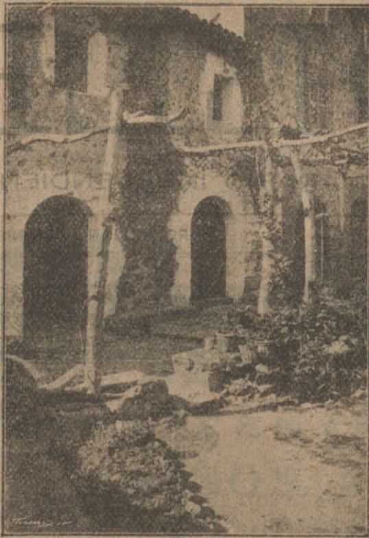
Vetusta casa de Ca'n Tamany, hogar de "Las Valentes Dones..."