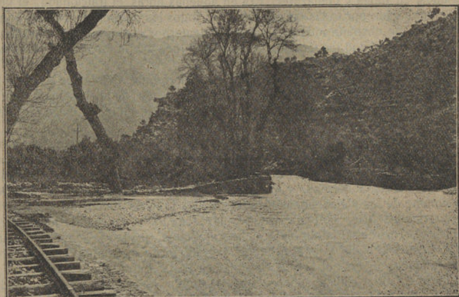
Imponente aspecto que ofrecía el torrente Mayor en el sitio conocido por el "Camp de sa Mà", con el inmenso caudal de agua que llevaba. Alcanzó ésta tal altura que la línea del tranvía, que aparece en primer término a la izquierda, fué socavada por las aguas.