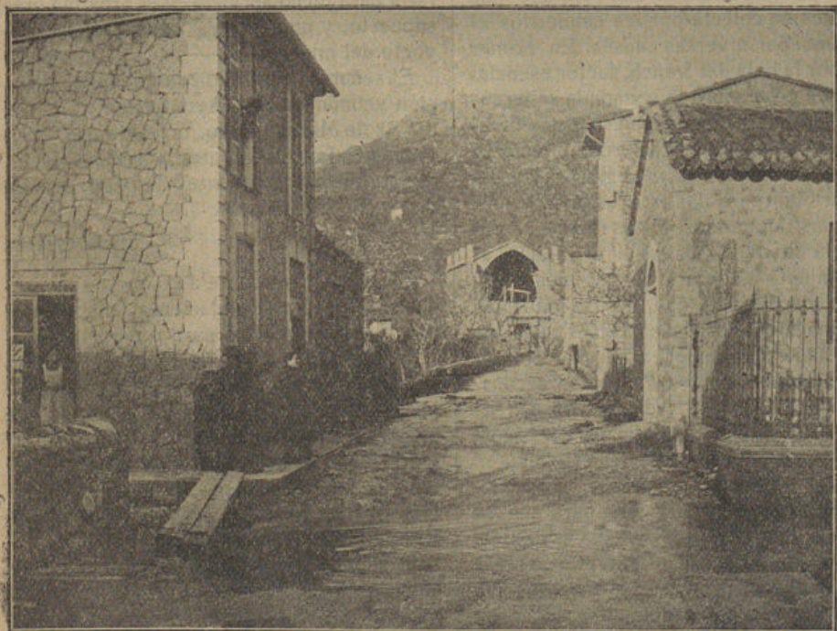
El camino que conduce a la iglesia de "l'Horta", convertido en un torrente, y en primer término la línea del tranvía en otro más caudaloso aún. En la iglesia pueden observarse también los efectos del vendaval de Diciembre último.

Para terminar estas líneas queremos hacer patente al fotógrafo D. Jaime Busquets y a la casa Thomas, de Barcelona, confeccionadora de los fotogramas, nuestro agradecimiento por el celo desplegado en facilitarnos nuestra tarea informativa, que por un alarde de actividad por parte de todos nos es dable ofrecer hoy a nuestros suscriptores.