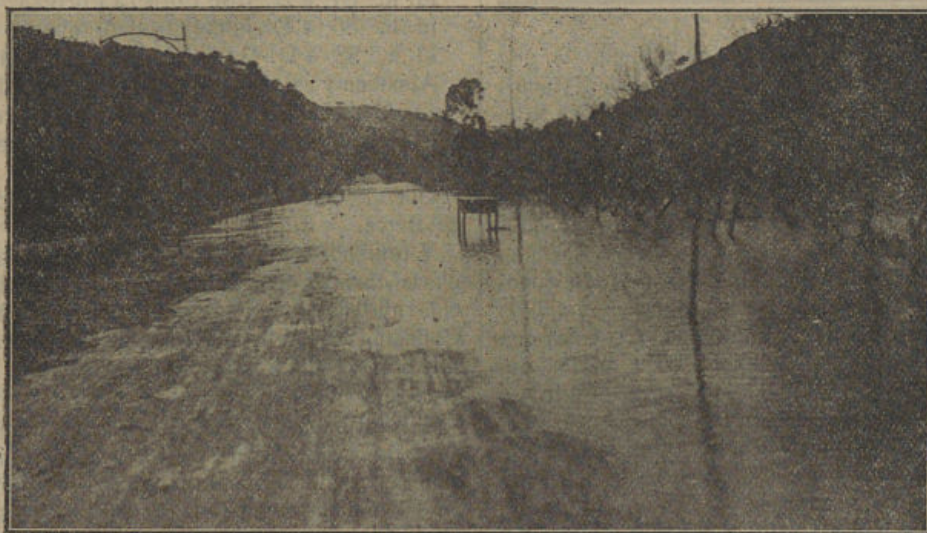
Gráfico que demuestra el estado en que quedó "l'Horta de baix", después del copiosísimo aguacero. Todas las fincas quedaron más o menos inundadas como este tramo de la carretera del Puerto en el sitio conocido por "Ca's Xocolaté", entre el paso a nivel del tranvía en "Ca'n Pauet", y el puentecillo del "Torrentó d'es Jaiot", en que las aguas alcanzaron más de un metro de altura en una grandísima extensión. En la fotografía aparecen sobre las aguas muebles de una casa cercana que arrastraron las aguas al penetrar en ella.

Este año, como el anterior, se presenta pródigo en calamidades públicas. Fresca aún en la memoria la impresión del deslizamiento de tierras en Els Marroigs y la del vendaval de