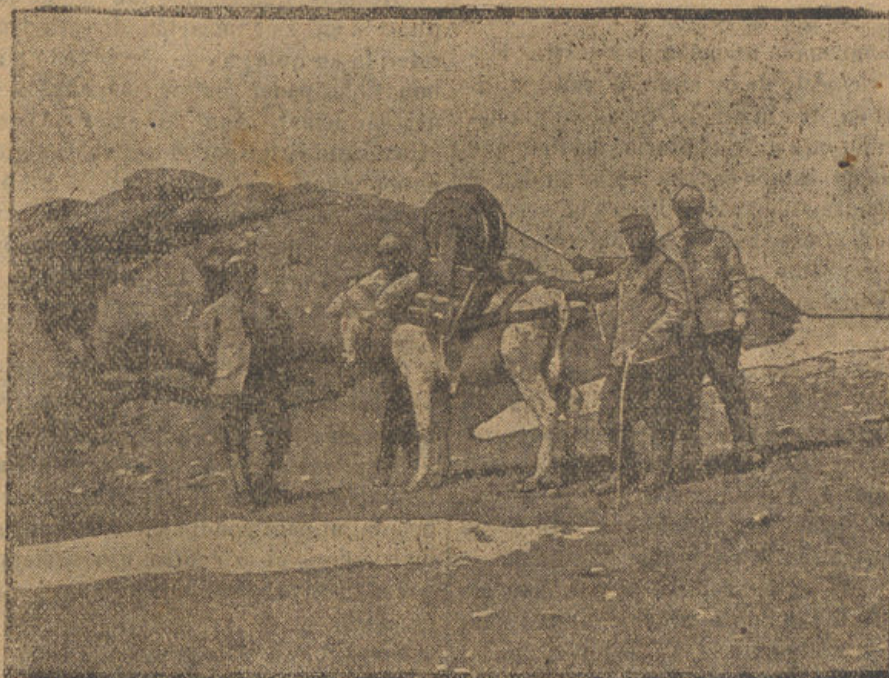
Ejército oriental.—Tendido de una línea telefónica