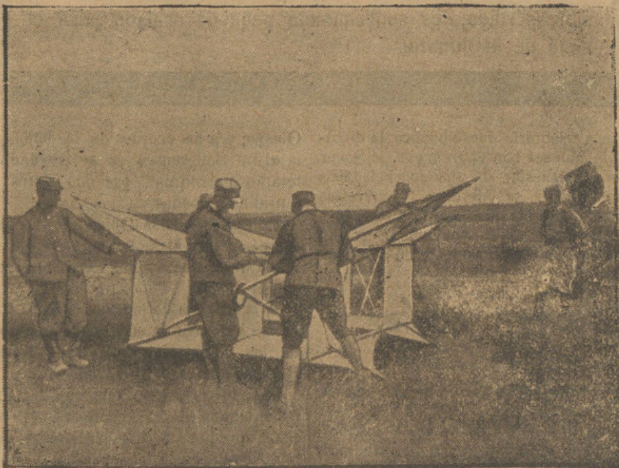
La sopa a bordo de un transporte